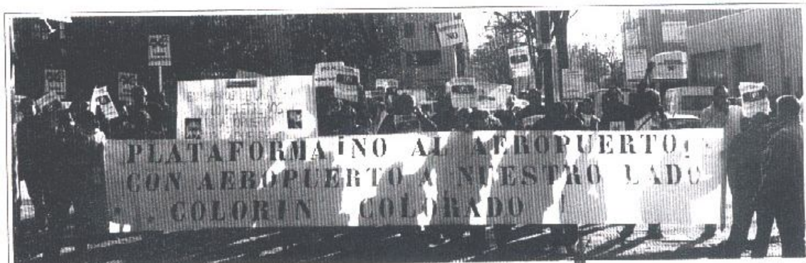
Concentración contra el aeropuerto frente al parlamento madrileño.

La segunda de las mentiras se desmonta poniendo el ejemplo de la Radial 5. ¿Conocen ustedes a alguien que trabajara en la construcción de la Radial 5? Las grandes empresas de construcción poseen cuadrillas de trabajadores que desplazan de unas obras a otras según su necesidad y nunca cuentan con trabajadores locales. Una vez construido el aeropuerto se trasladarán los trabajadores de Cuatro Vientos. El Alcalde de El Álamo argumenta que se generará un polígono Industrial que dará trabajo a los y las vecinas de los municipios cercanos. Ese polígono ya estaba proyectado en el Plan General de Ordenación Urbana que tiene paralizado el Partido Popular para su modificación. En esta modificación incluirán el aeropuerto y reducirán a cero el crecimiento de El Álamo, tanto las actividades urbanísticas e industriales, que son el motor de crecimiento de un pueblo. Con un aeropuerto en nuestro entorno AENA(Aeropuertos Españoles y Navegación Aérea) no autorizaría los desarrollos urbanísticos en nuestros municipios.