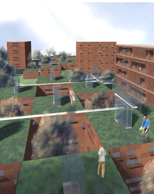
Imagen representativa del Proyecto

El uso residencial se completa con la implantación del terciario de proximidad (TP) previsto en el Plan Parcial UZP 1.01