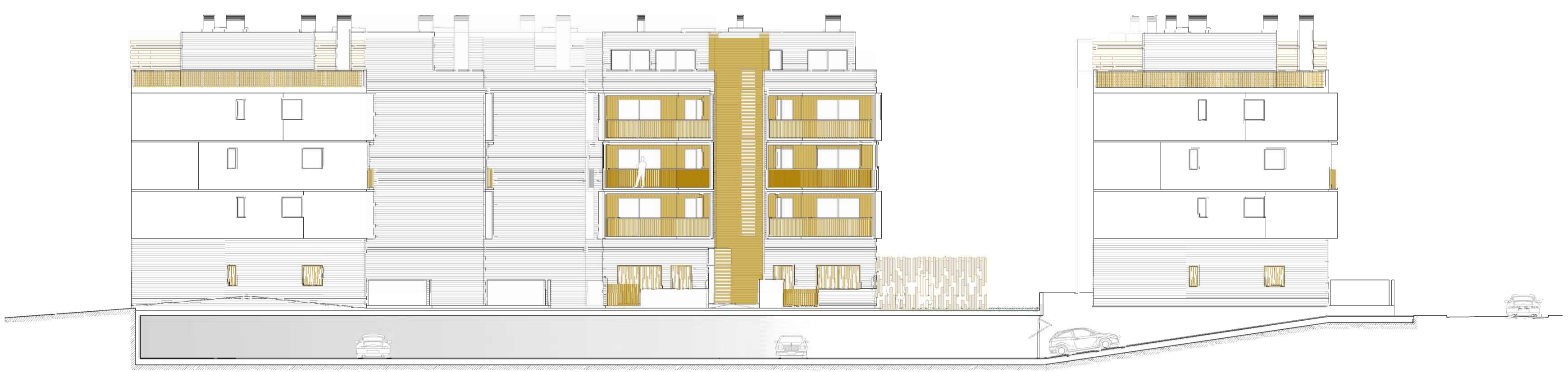
alzado d-d' escala 1/200