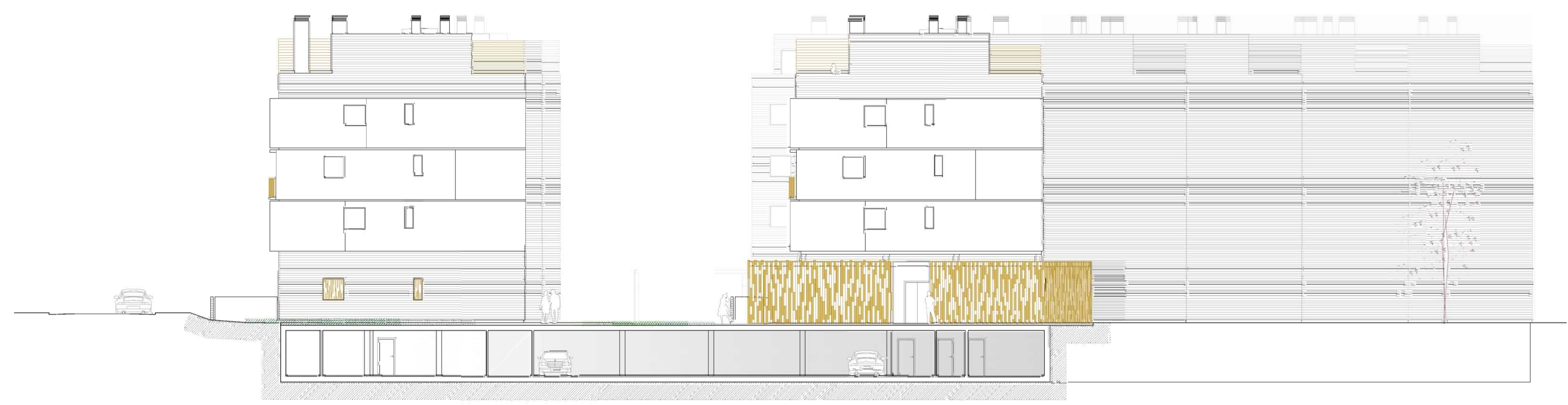
alzado c-c' escala 1/200