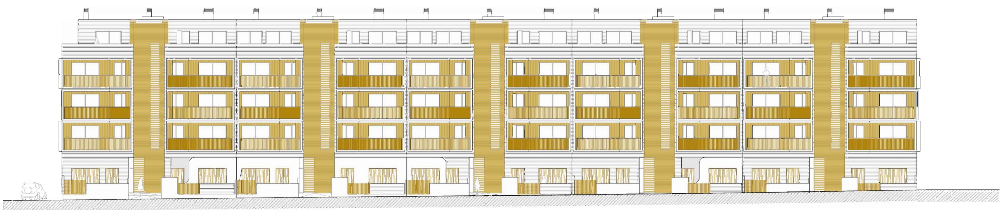
alzado a-a' escala 1/200