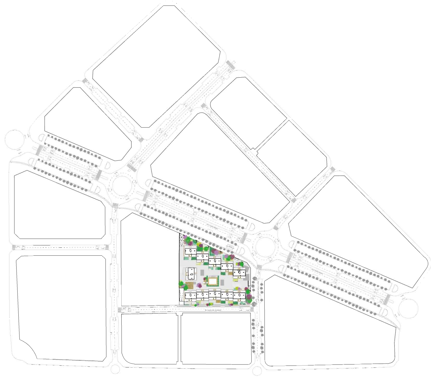
planta emplazamiento escala 1/2.500