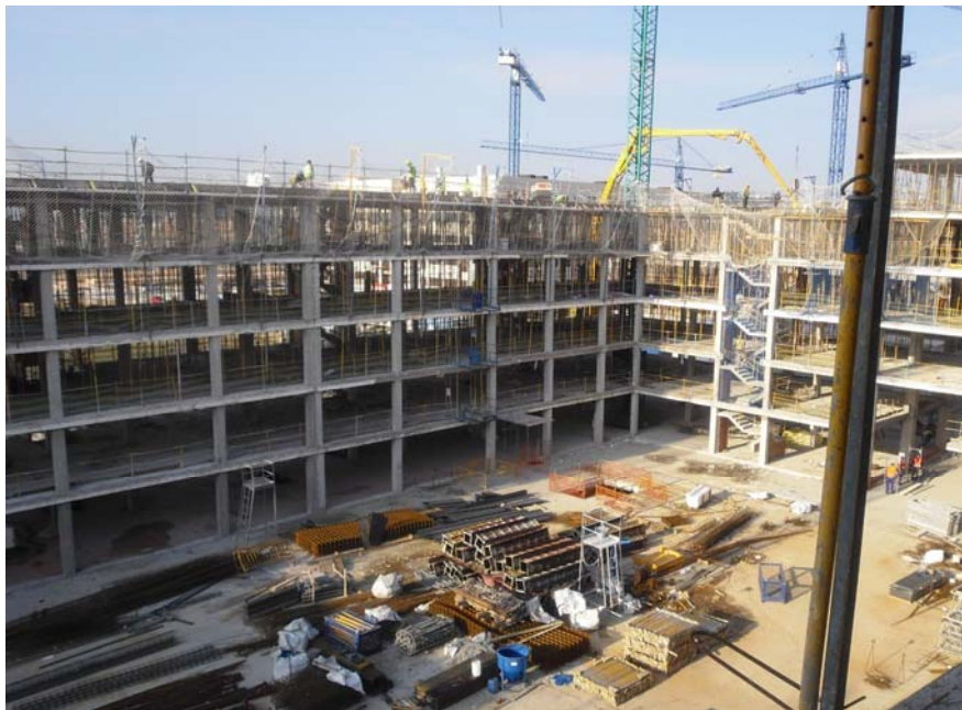
VISTA DE LOS ALZADOS INTERIORES NORTE-ESTE