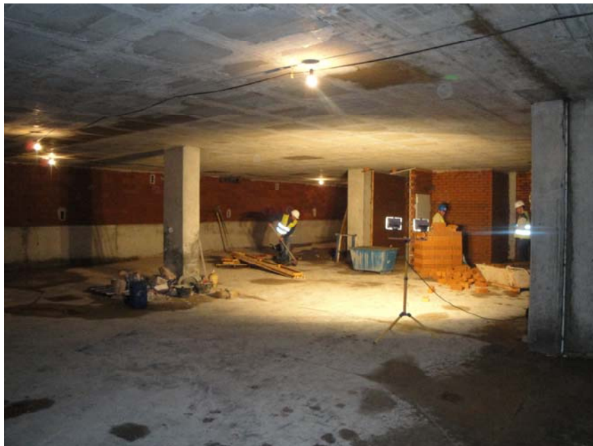
TRABAJOS DE ALBAÑILERIA EN SOTANO 2