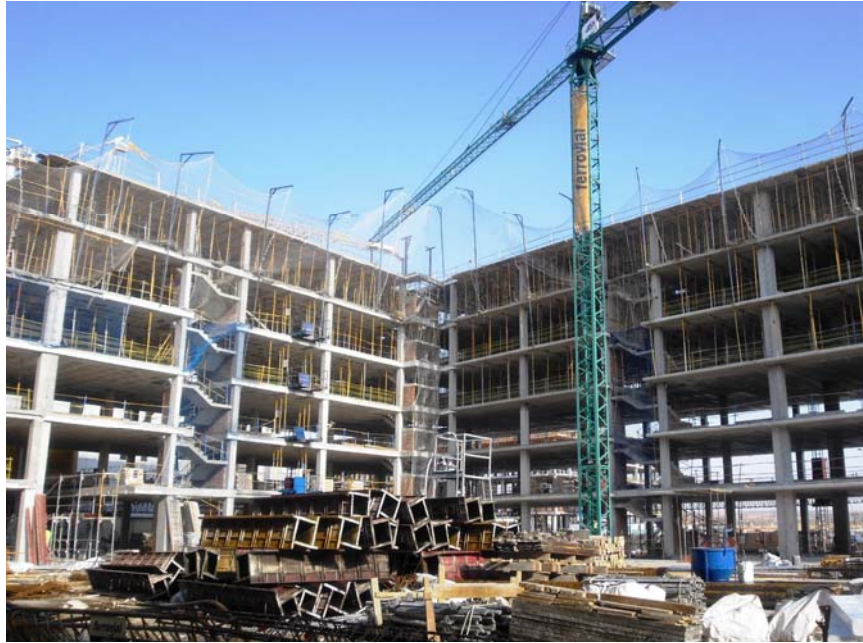
VISTA DE LOS ALZADOS INTERIORES ESTE-SUR