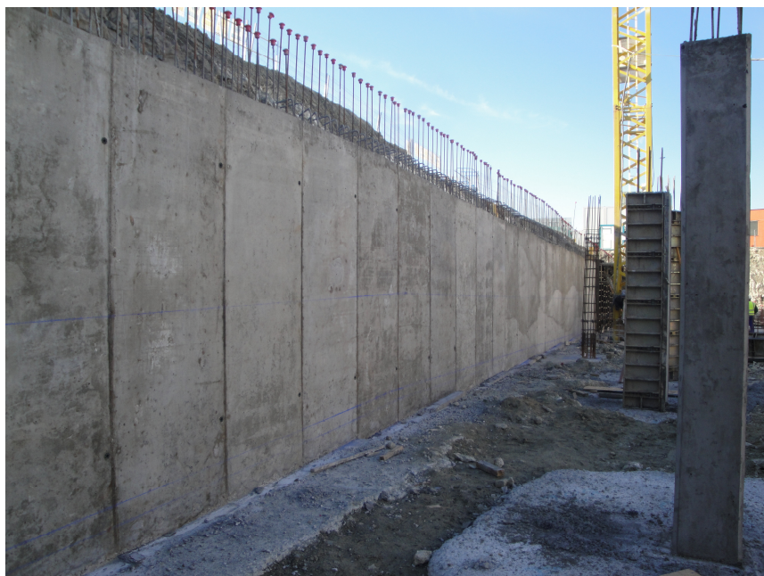
MURO DE HORMIGON DE CONTENCIÓN DE SOTANO 2