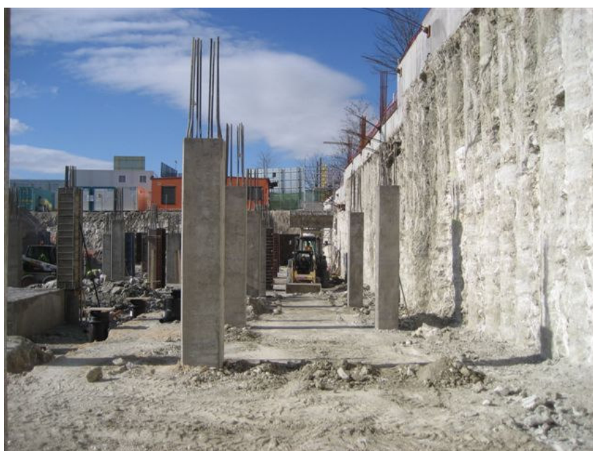
PILARES HORMIGONADOS DE SOTANO 2