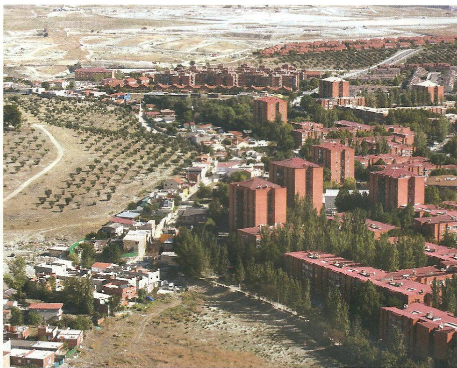
Vista aérea de la Cañada Real a su paso por Rivas

R: En primer lugar habrá que determinar qué personas tiene derecho a un realojo porque en la Cañada hay que hacer una distinción entre todos sus ocupantes. Por un lado tenemos a los ocupantes de esas mansiones, que por supuesto no tienen ningún derecho; por otro a los delincuentes (traficantes de drogas y de armas) que será la justicia la que actuará sobre ellos y finalmente están los excluidos sociales, que serán los realojados. Este proceso lo tendrá que llevar a cabo el IRIS (Instituto de Reajamiento e Integración Social de Madrid) y se hará por toda la Comunidad de Madrid.