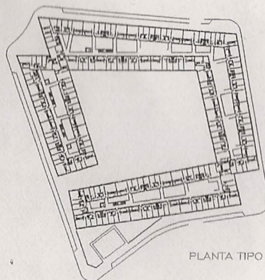
PLANTA TIPO 1, 2, 3