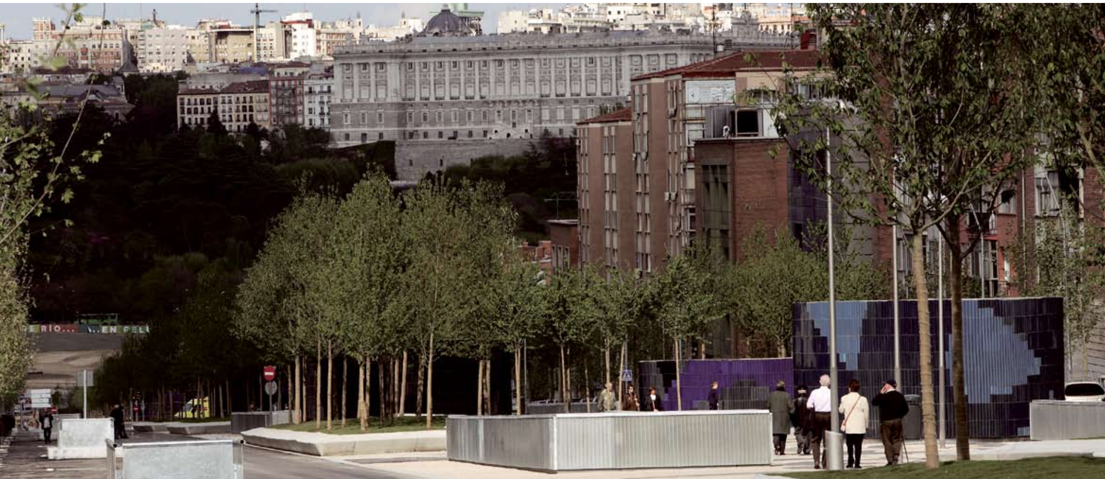
Avenida de Portugal. LATINA - MONCLOA - ARAVACA.