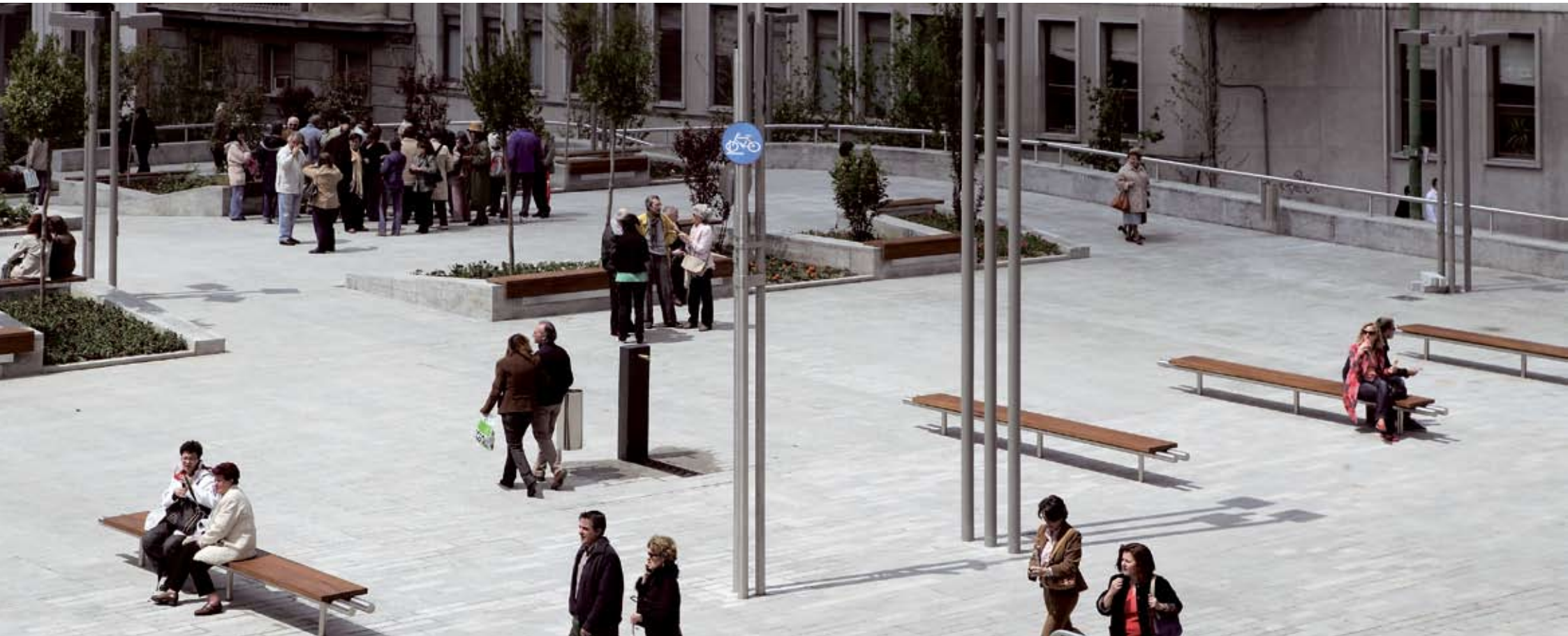
Plaza de Santo Domingo. CENTRO.