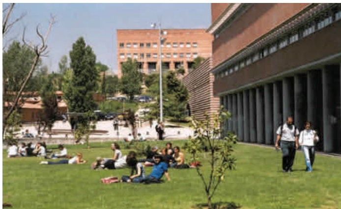
Campus Universidad Autónoma de Barcelona

Los estudiantes, fuera de los entornos lectivos (aulas, biblioteca o laboratorios), han de poder relacionarse entre sí y participar de la vida urbana del barrio y la ciudad. Para ello hace falta un entorno amigable y accesible simplemente caminando.