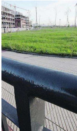
La parcela donde se construirá el tercer colegio de La Corredoria, para villanueva

En los dos colegios de Primaria de La Corredoria estudian este año 1.277 alumnos.