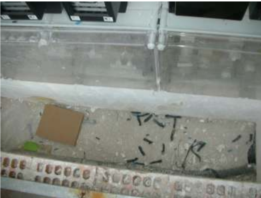
Hilada de ladrillos sin enfoscar y el suelo con restos de material eléctrico