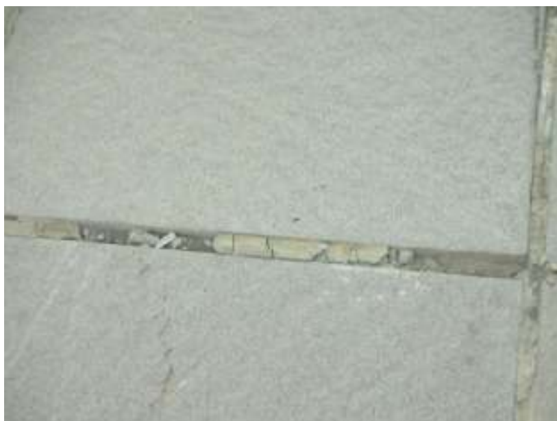
Juntas de dilatación en mal estado