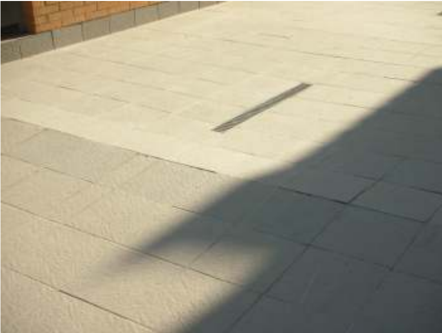
Juntas de dilatación levantadas, que están provocando que las baldosas se estén rompiendo