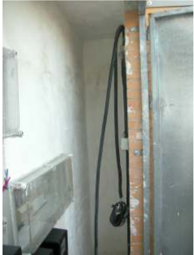
Luces sin colgar