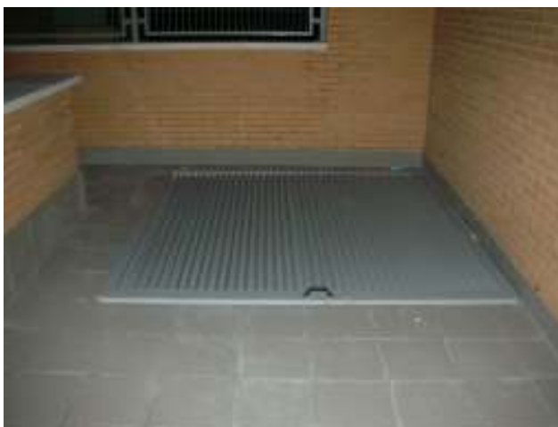
La puerta se encuentra en el suelo, junto a la bajada peatonal al garaje.