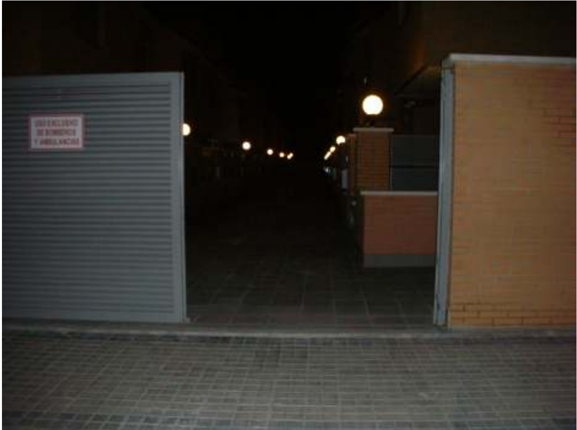
La bisagra superior se ha quedado en el marco de la puerta y la bisagra inferior se ha quedado en la puerta