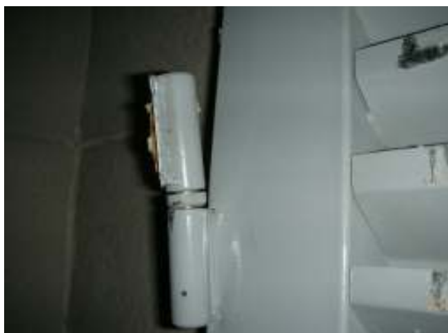
Detalle de la bisagra inferior rota (el marco de la puerta se encuentra también dañado)