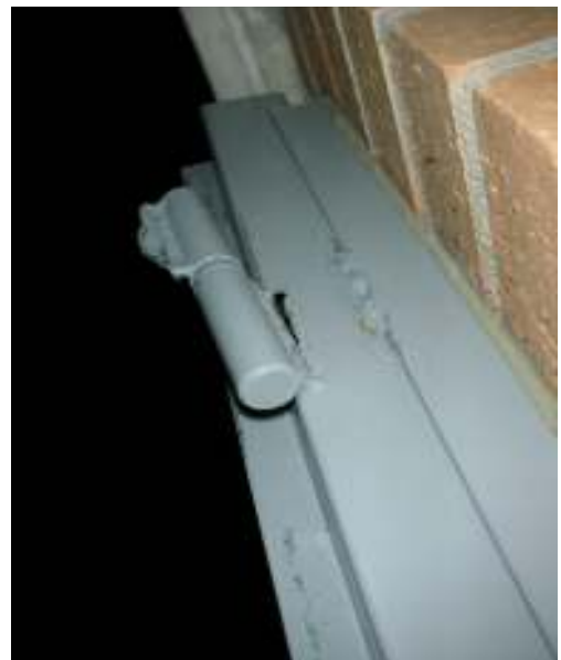
Se observa la bisagra superior arrancada de la puerta, así como un ladrillo semi-arrancado en la cuarta hilada, junto al marco de la puerta.