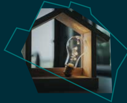
Destino Innovación Destinació Innovació