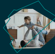
Destino Experience Destinació Experience