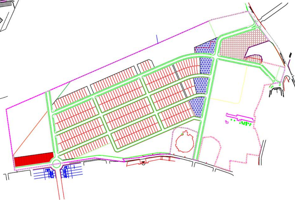
SITUACIÓN EN EL SECTOR