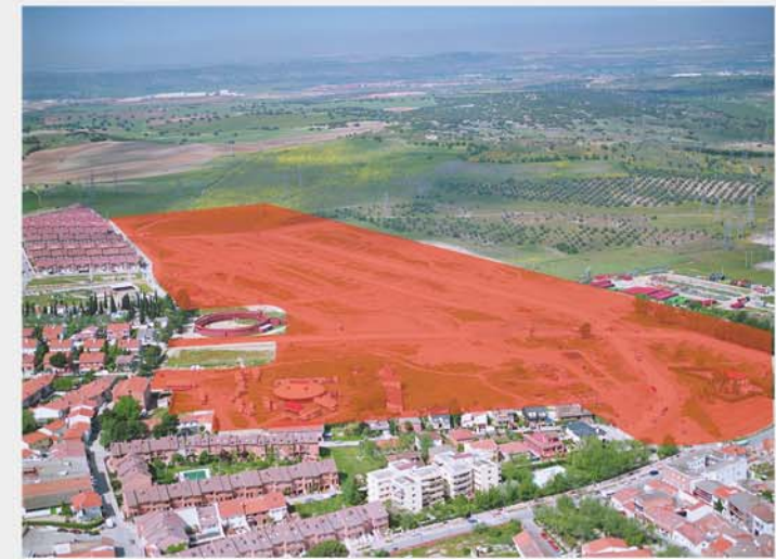
LOECHES/SAU2-15.3B-2005 2005-11-08 / 1