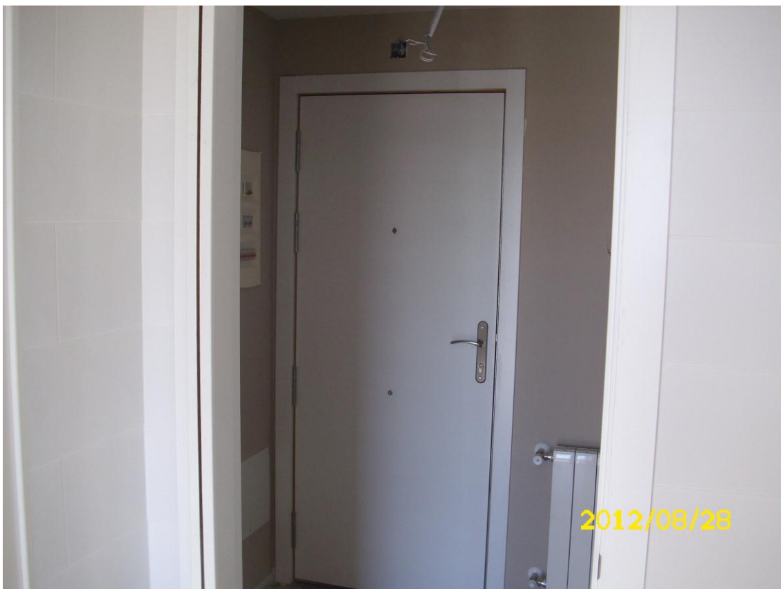
VESTIBULO INTERIOR DE VIVIENDA DESDE COCINA