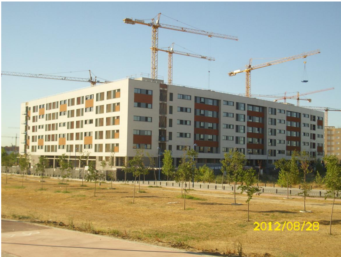
FACHADA EXTERIOR PORTALES 5, 6, 7, 8, 9, 10 Y 11