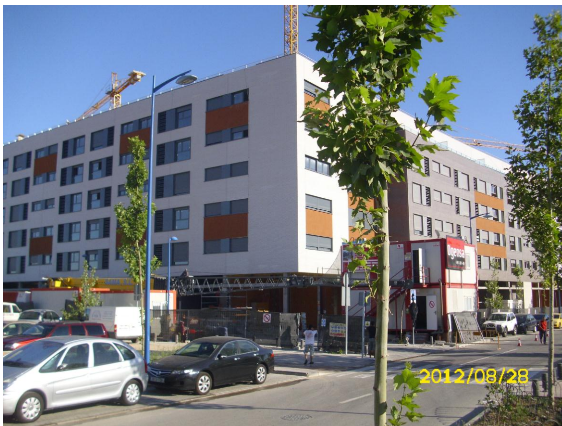
FACHADA EXTERIOR PORTALES 12, 1, 2, 3, 4 Y 5