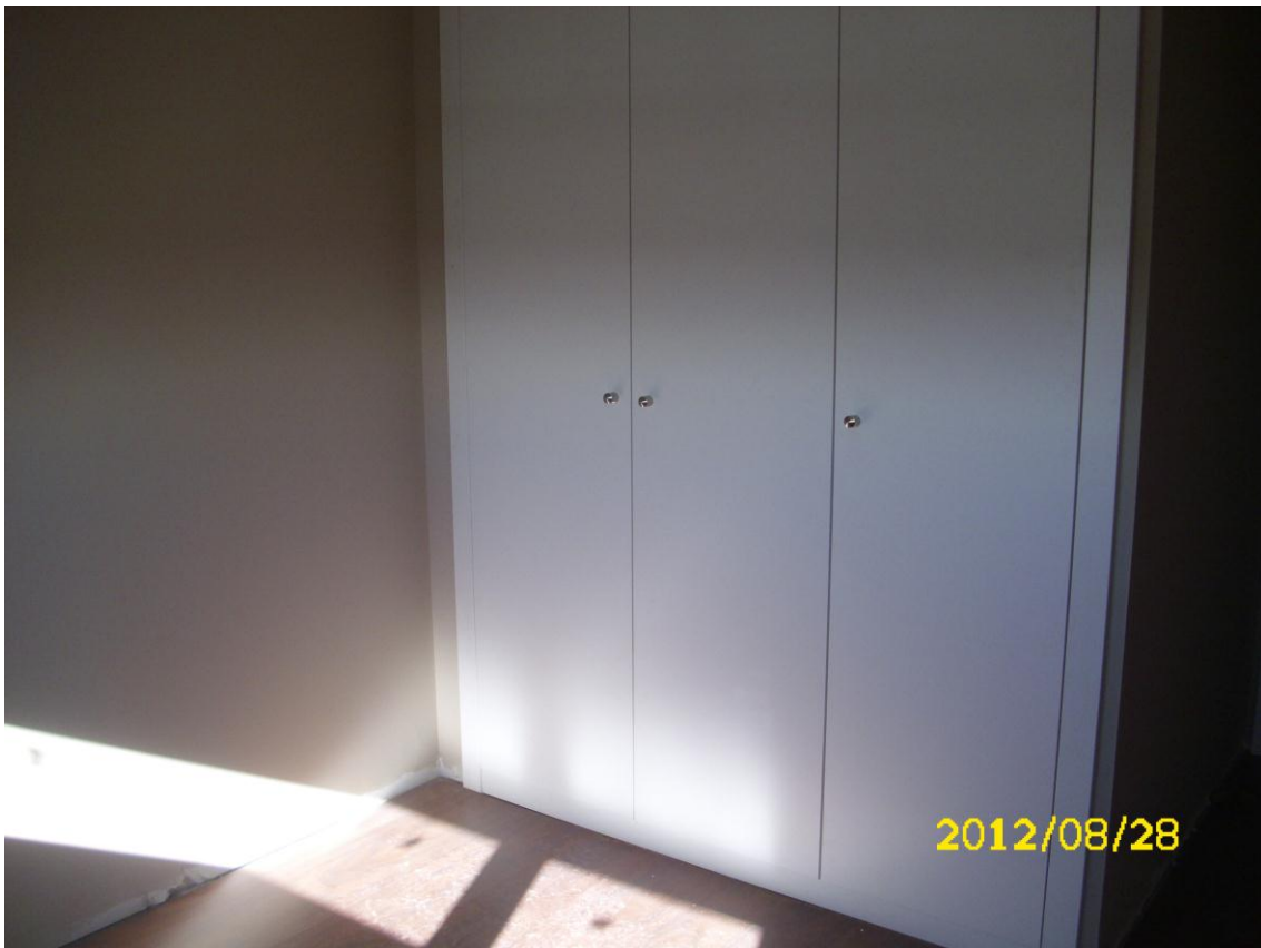
ARMARIOS DE DORMITORIOS