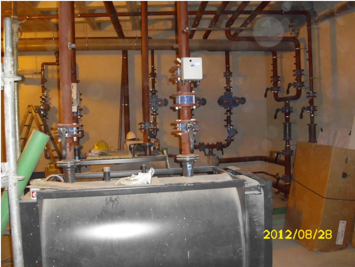
SALA DE CALDERAS