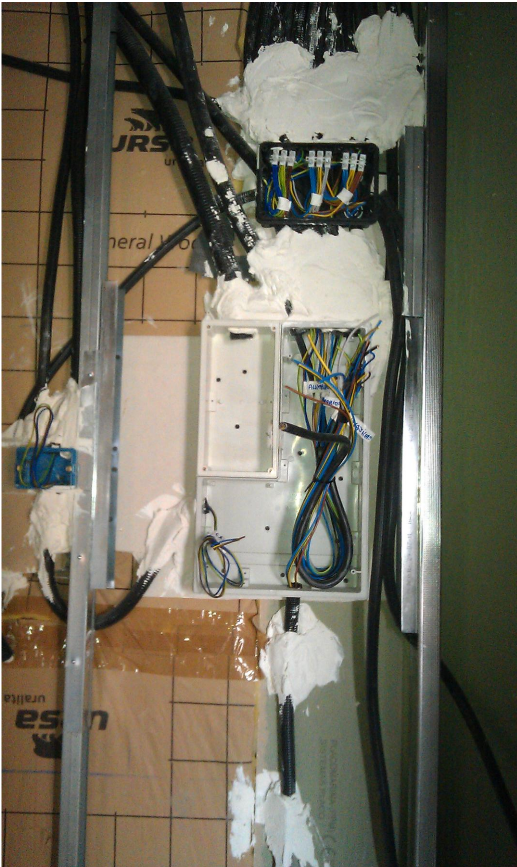
DETALLES DE EJECUCIÓN DE TABIQUERÍA DE PLADUR (PRIMERAS CARAS)