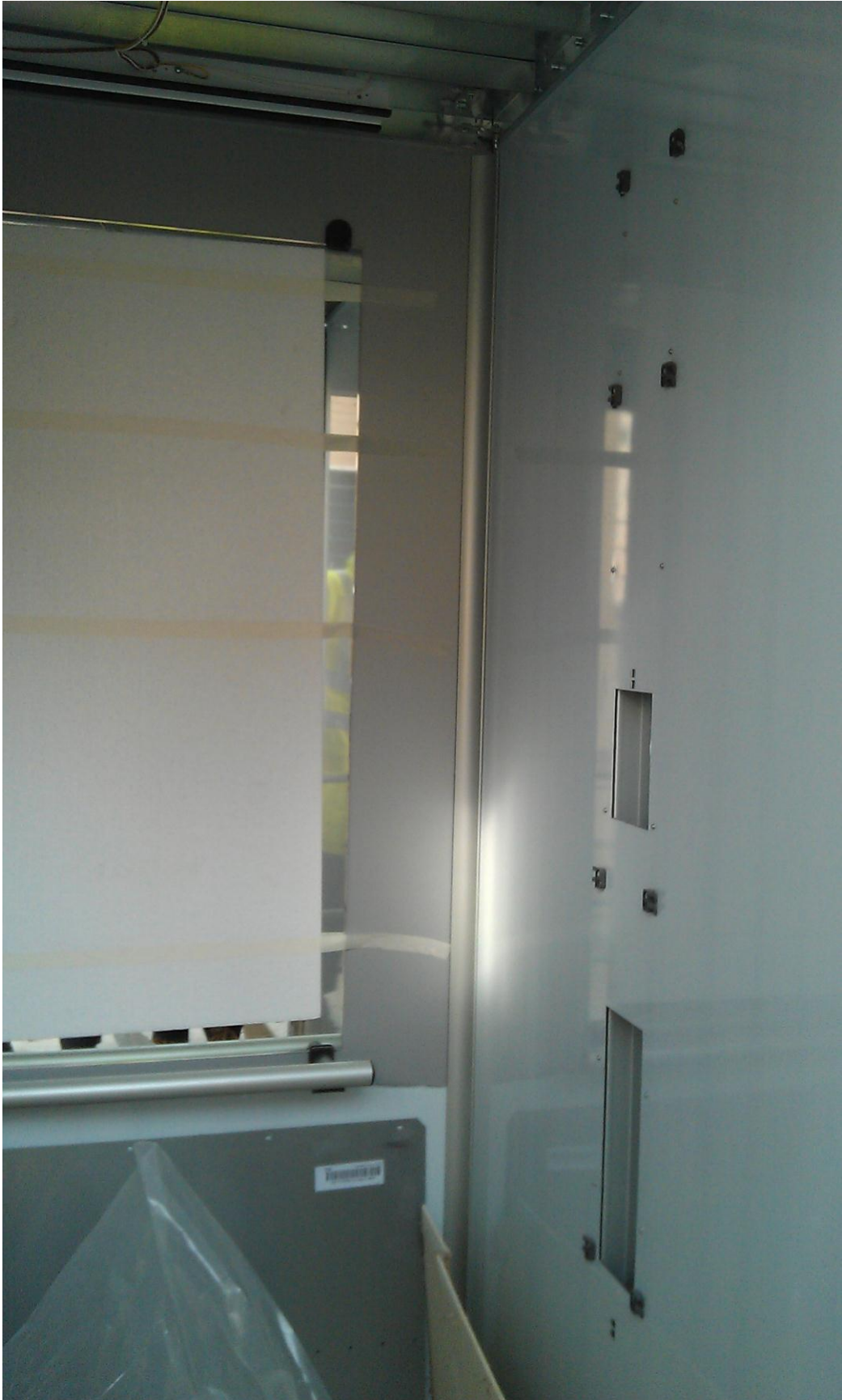
CABINA DE PORTAL 4