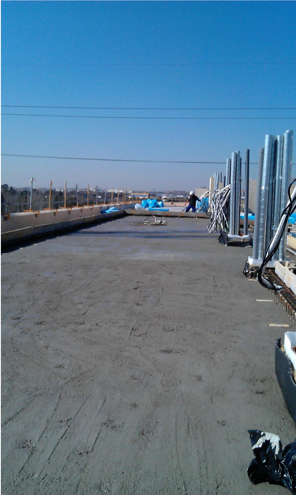
HORMIGONADO DE LOSA DE CUARTO DE CALDERAS (BLOQUE 3)