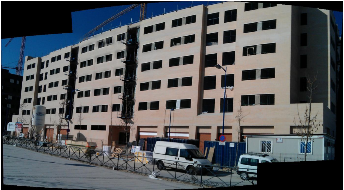
PANORÁMICA DE FACHADA PRINCIPAL CARA VISTA