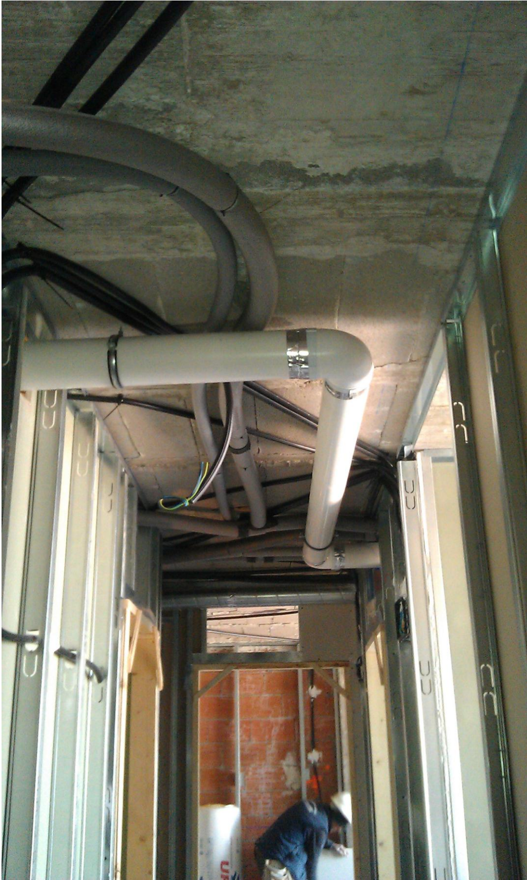
INSTALACIONES DE ELECTRICIDAD, VENTILACIÓN Y FONTANERÍA DE VIVIENDA