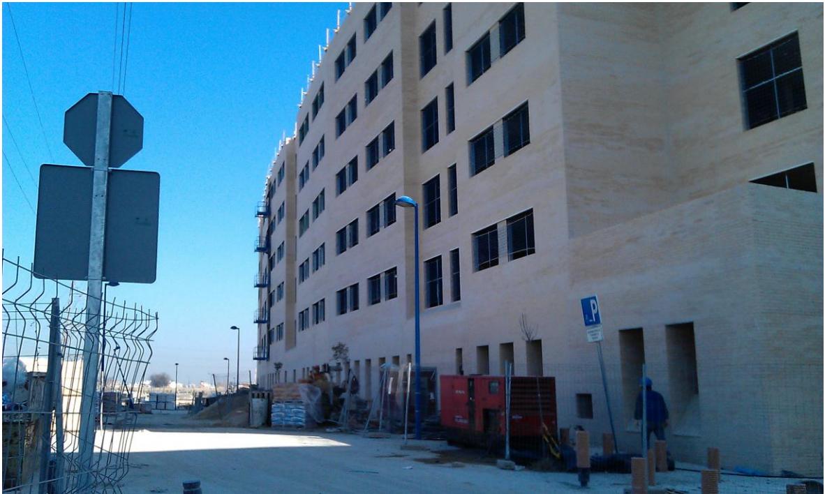
VISTA TRASERA DE CARA VISTA DE LA PROMOCIÓN