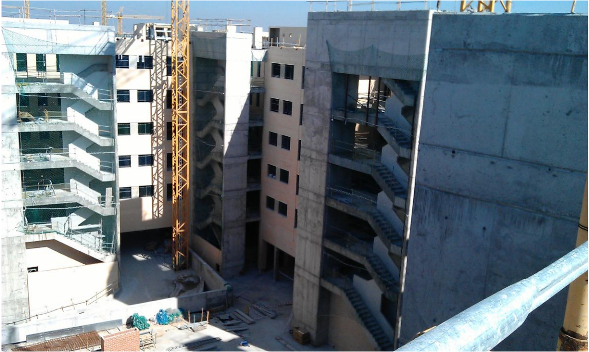
VISTAS GENERALES DE FACHADAS INTERIORES DE CARA VISTA