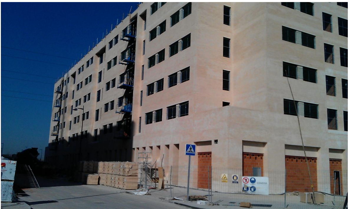
VISTA LATERAL 1 FACHADA CARA VISTA