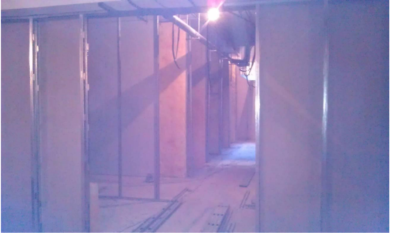
TRABAJOS DE COMPARTIMENTACIÓN EN TRASTEROS