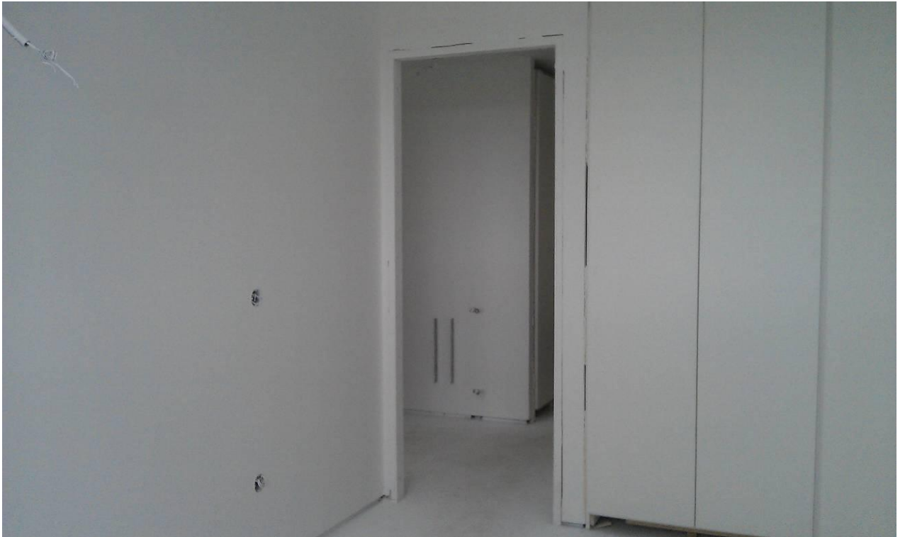
TRABAJOS DE PINTURA DENTRO DE VIVIENDAS