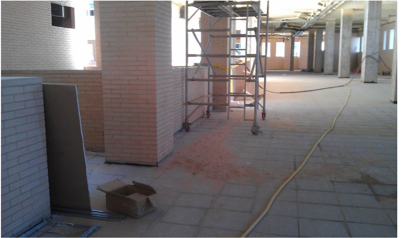
SOLADO DE TERRAZO ABUJARDADO EN SOPORTAL (EN PASILLO DE PORTALES 6, 5 Y 4)