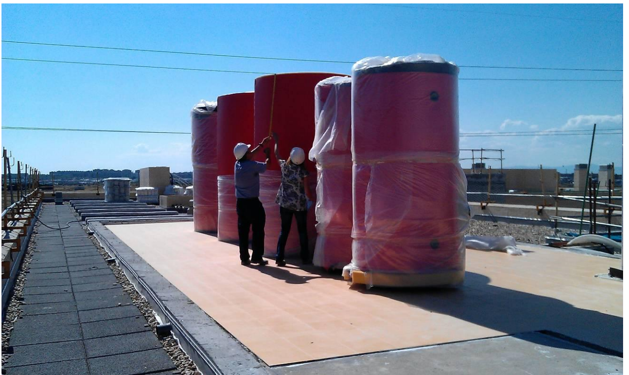
SOLADO DE CUARTO DE CALDERAS