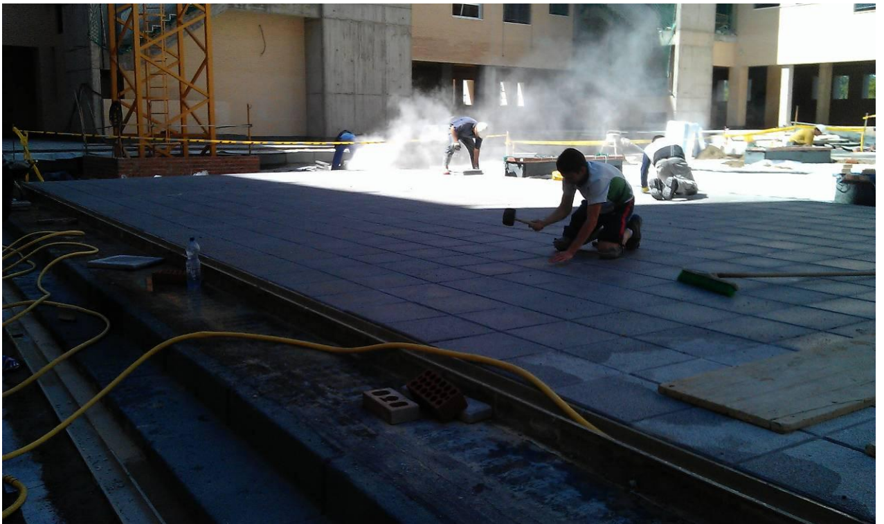
SOLADO DE TERRAZO ABUJARDADO EN PATIO INTERIOR