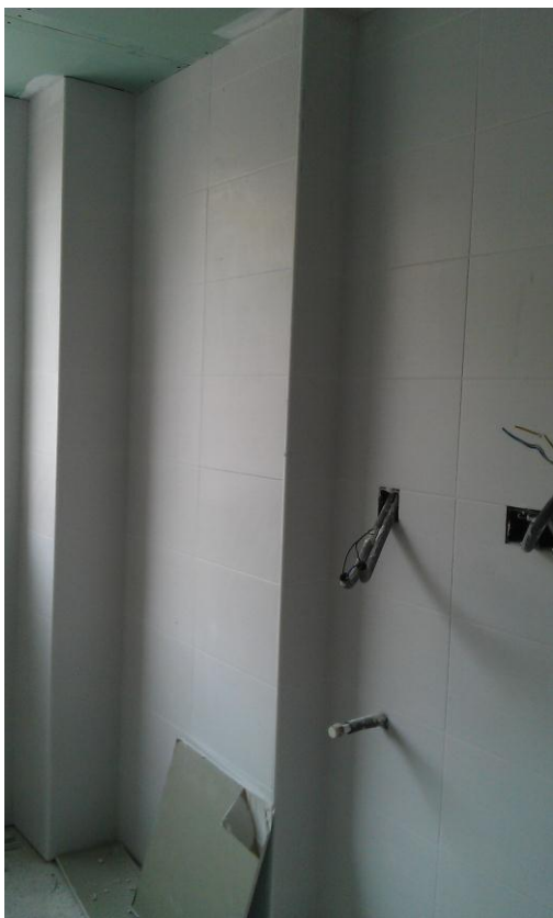
ALICATADO EN COCINA