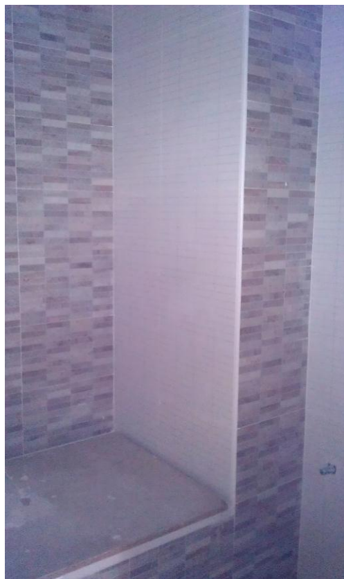
ALICATADO EN BAÑO PRINCIPAL