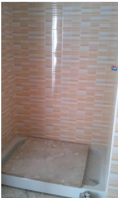
ALICATADO EN BAÑO SECUNDARIO

COMIENZO DE TRABAJOS DE ALICATADOS EN VIVIENDA