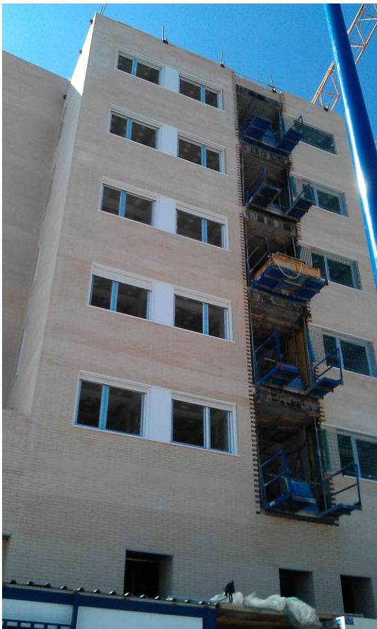
CARPINTERÍAS EXTERIORES EN FACHADA DE BLOQUES 8 Y 1