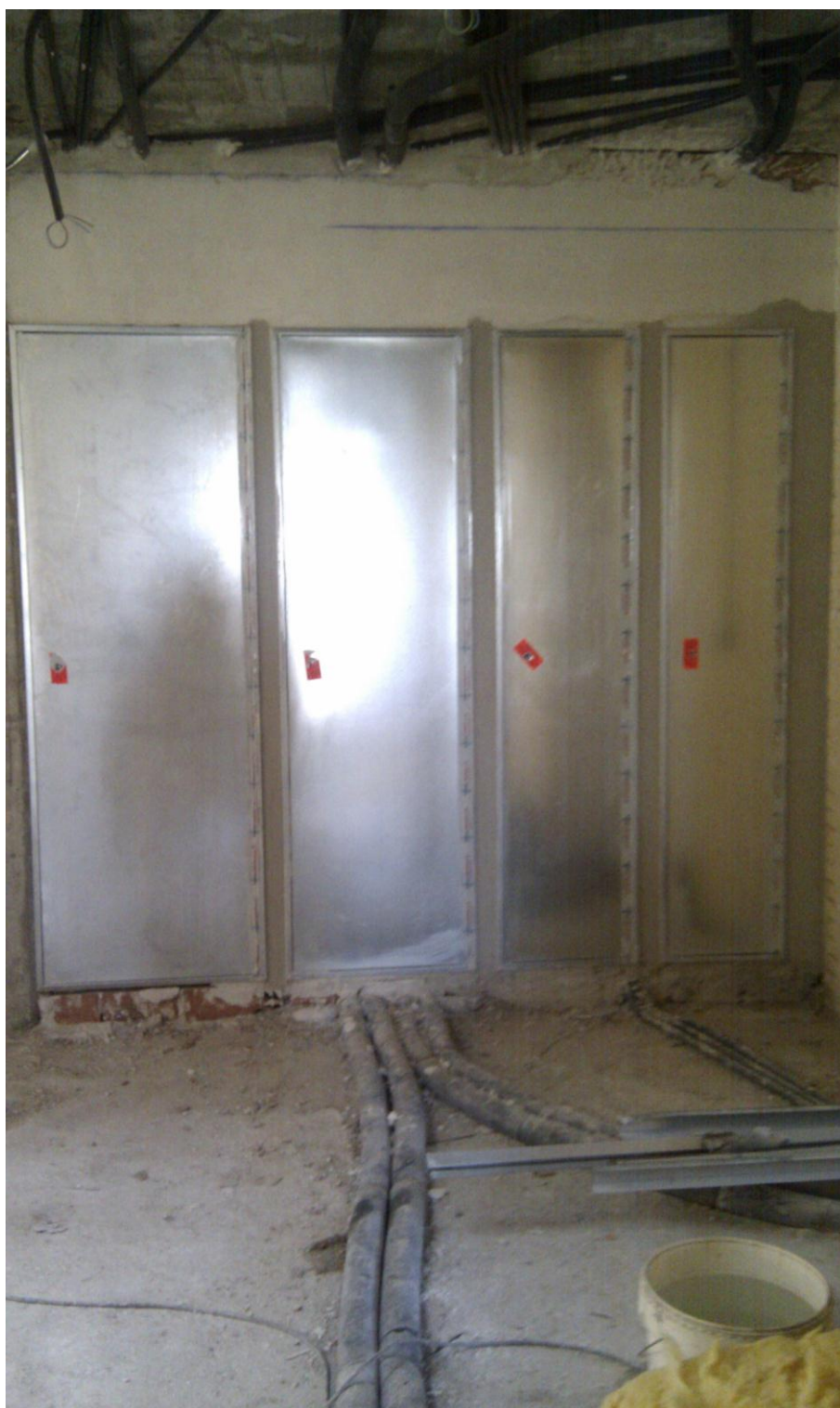
REGISTROS DE PATINILLOS DE INSTALACIONES EN ZONAS COMUNES