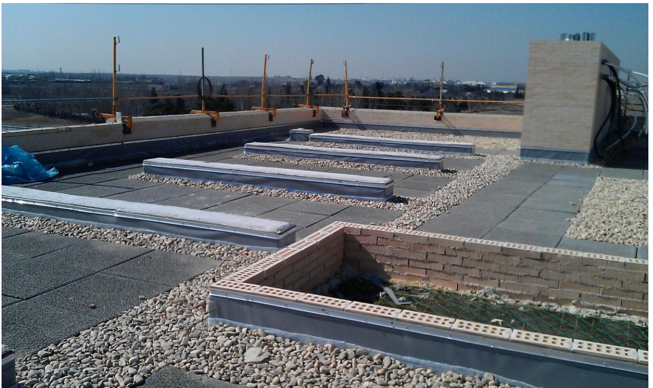
CUBIERTA ACABADA. ZONA PREPARADA PARA APOYO E INSTALACIÓN DE PANELES SOLARES