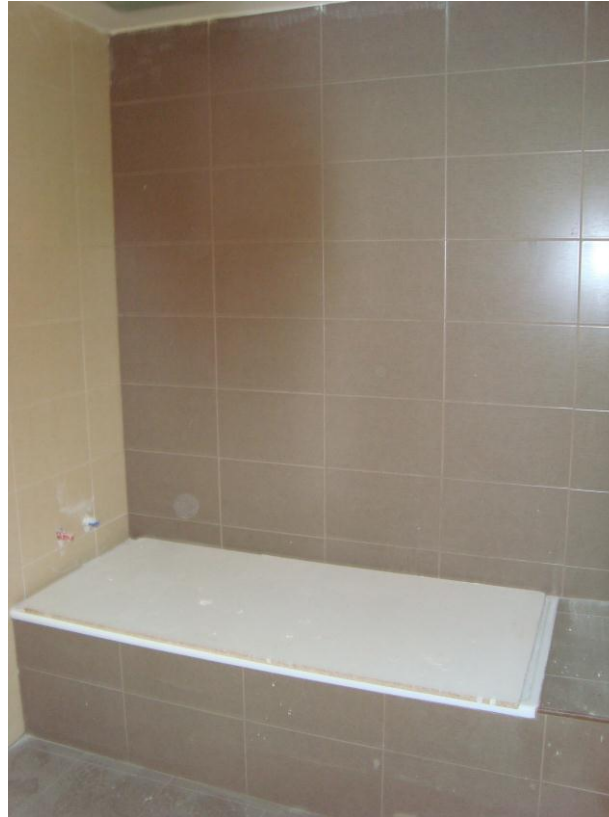
ALICATADO BAÑO PRINCIPAL