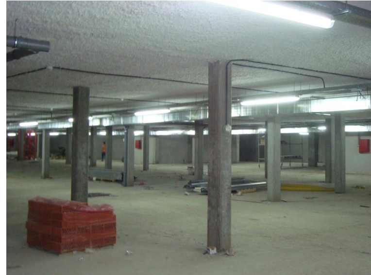
ILUMINACIÓN Y VENTILACIÓN GARAJE