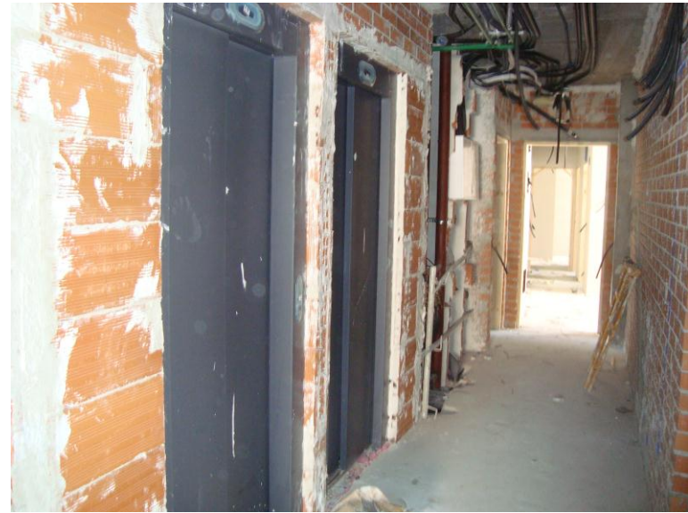
COLOCACIÓN PUERTAS ASCENSOR