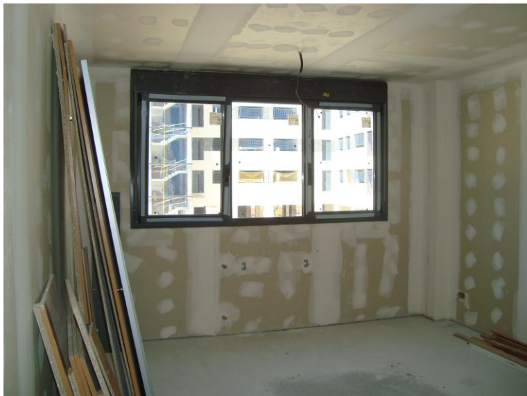
CARPINTERIA DE ALUMINIO