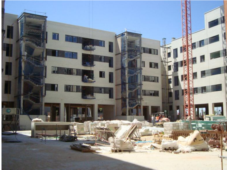
ESTADO GNERAL PATIO INTERIOR