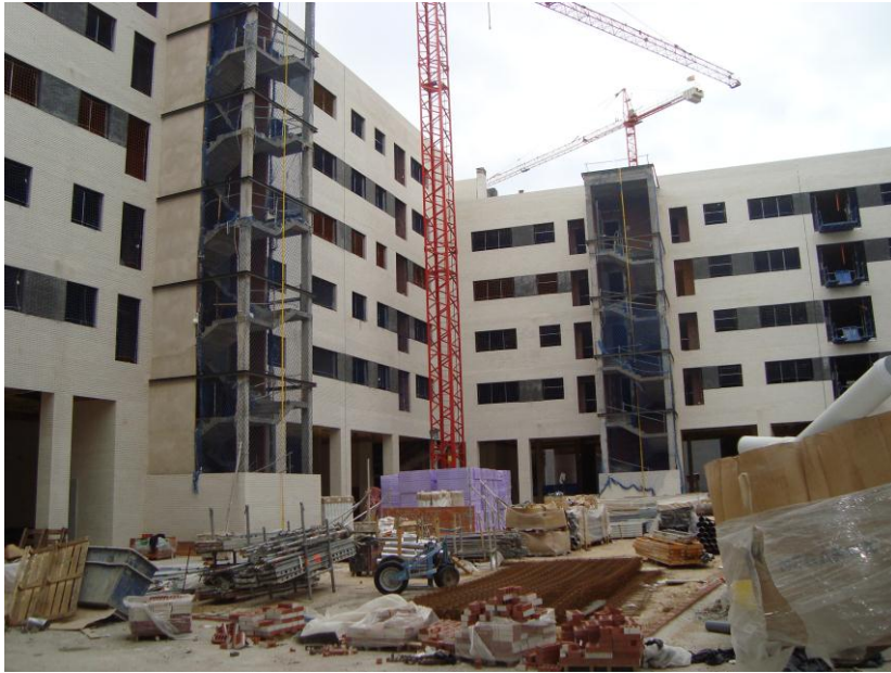
VISTA GENERAL FACHADA INTERIORES TERMINADAS