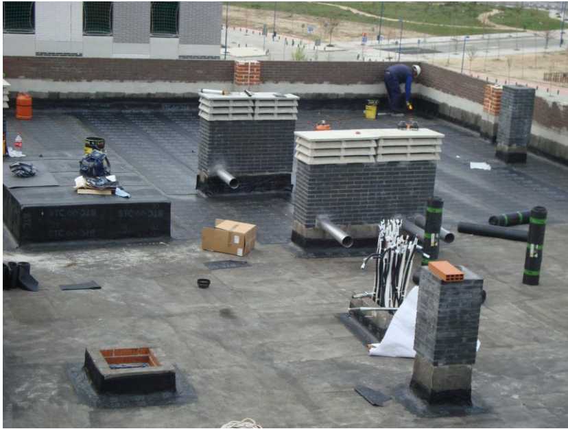
EJECUCIÓN CUBIERTA VIVIENDAS PORTAL 4