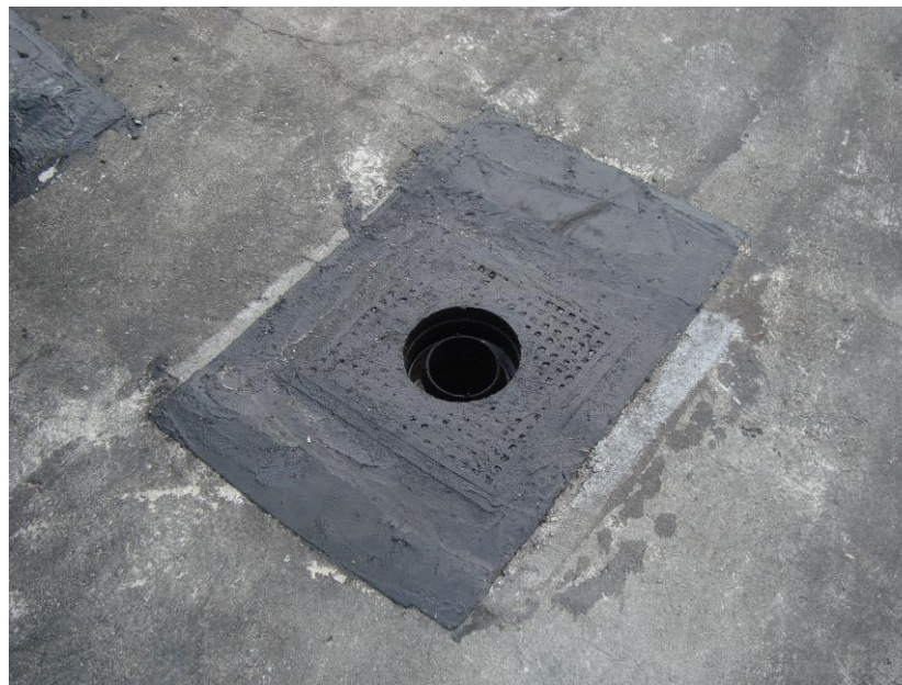
DETALLE REFUERZO SUMIDERO EN CUBIERTAS