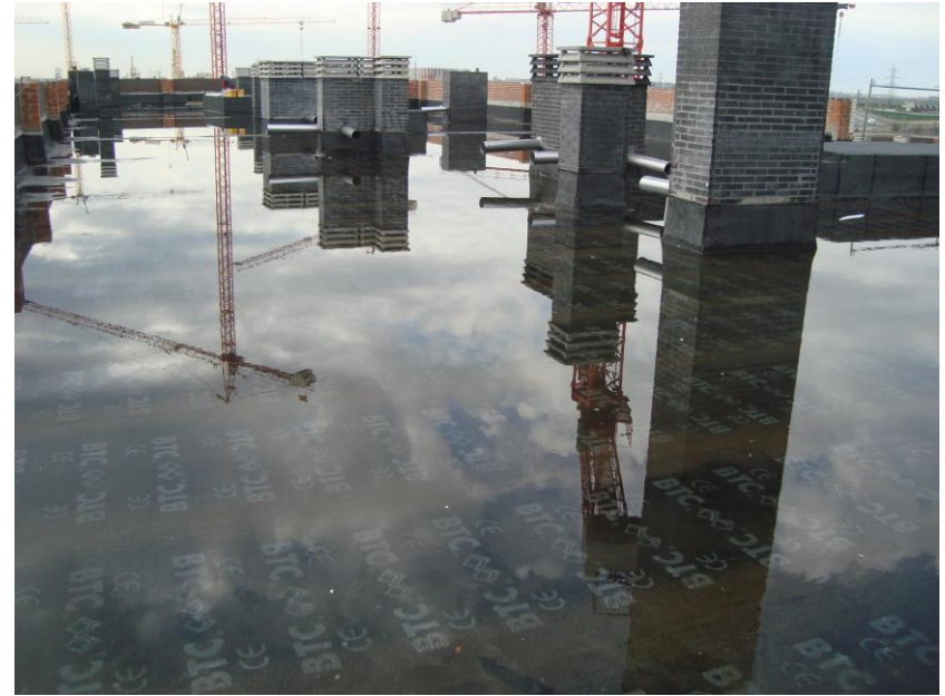
PRUEBA DE AGUA CUBIERTA VIVIENDAS