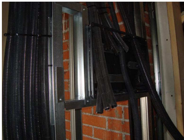
DETALLE CUADRO ELÉCTRICO EN VIVIENDAS