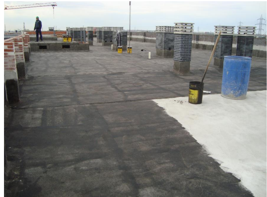
PREPARACIÓN CUBIERTA VIVIENDAS PARTALES 5 y 6