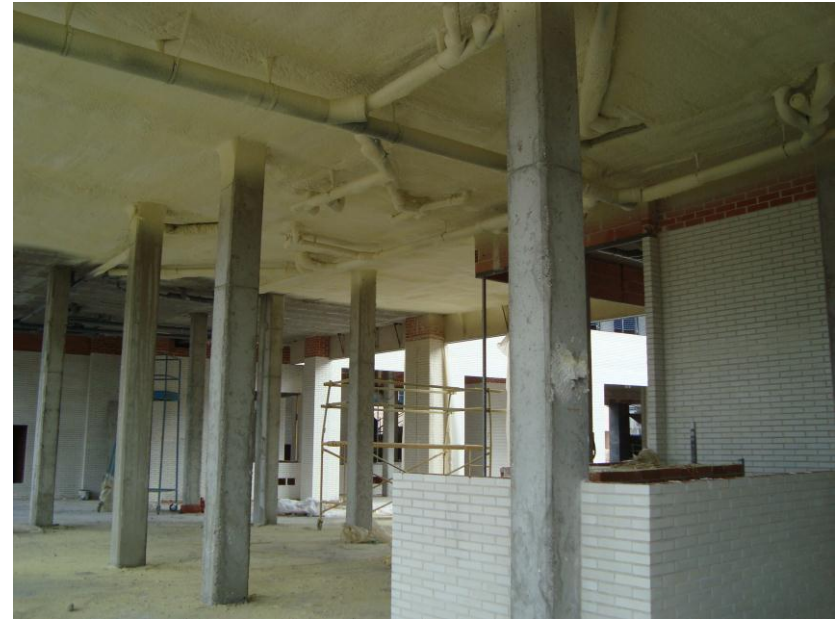
AISLAMIENTO TECHO P. BAJA