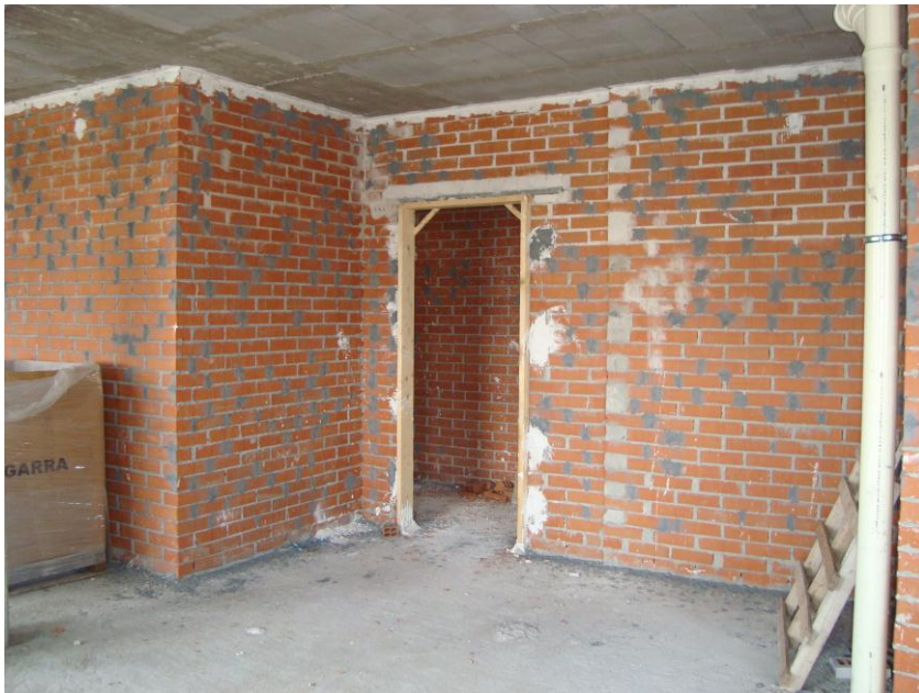
TAPADO LLAGAS SIN MORTERO EN PARTICIONES FÓNICAS