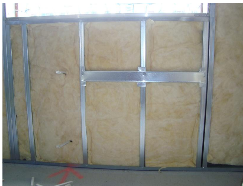
REFUERZO EN PLADUR PARA CUELGUÉ DE RADIDORES