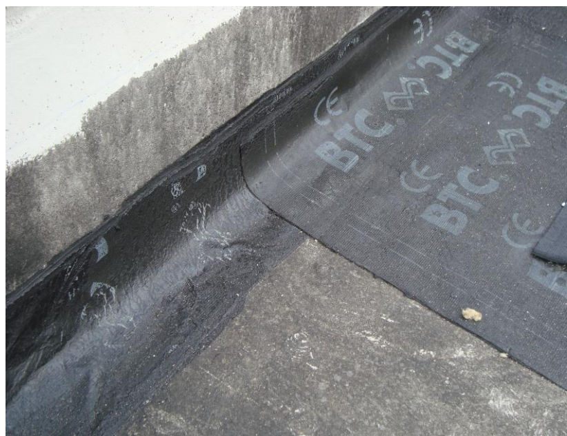
DETALLE EJECUCIÓN IMPERMEABILIZACIÓN CUBIERTA VIVIENDAS