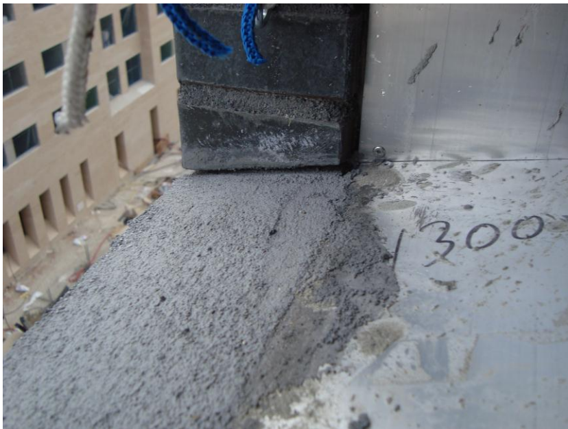
EJECUCIÓN CORTE EN VENTANA PARA ENCAJE VIERTEAGUAS