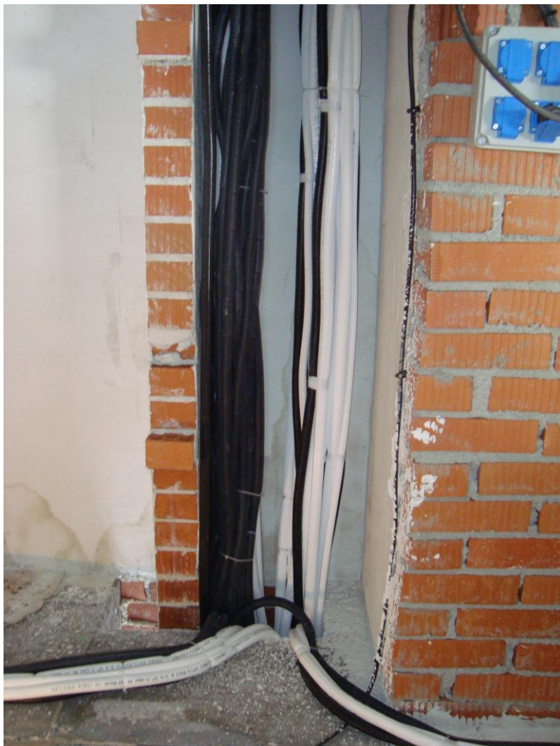
MONTANTES PREINSTALACIÓN AA