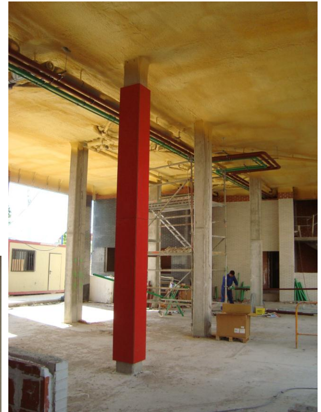
MUESTRA FORRO PILARES. COLOR DEFINITIVO GRIS