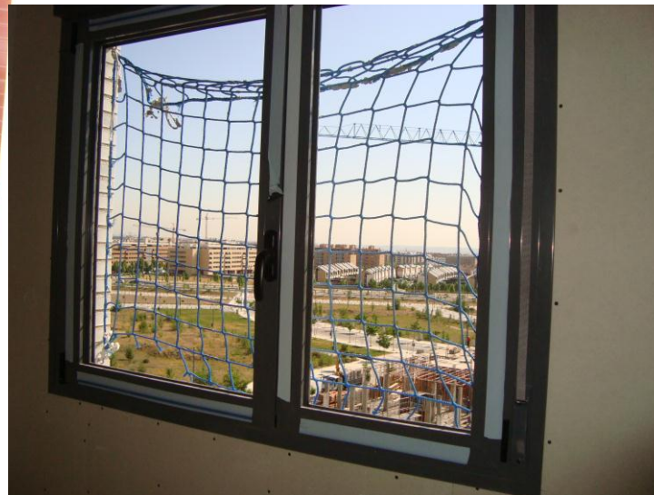
MUESTRA CARPINTERIA EN VENTANAS