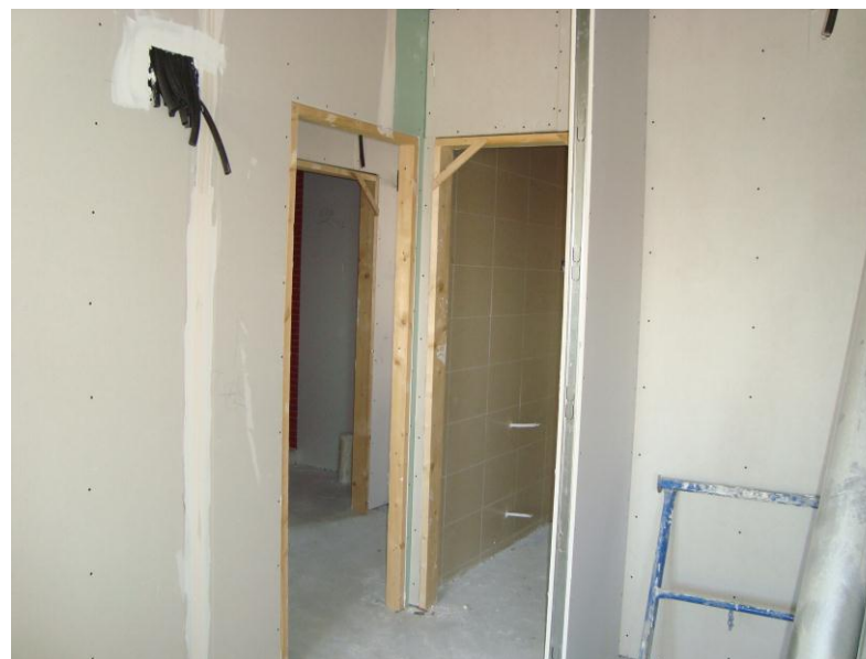
EJECUCION DIVISIONES EN INTERIOR DE VIVIENDA CON PLADUR