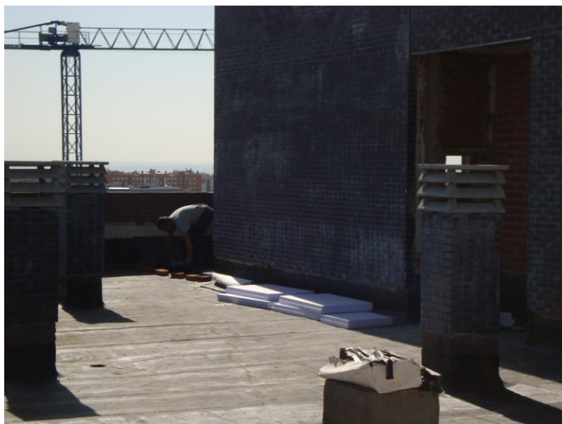
EJECUCION DE CUBIERTA