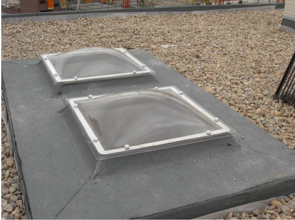
Claraboyas portal 2.