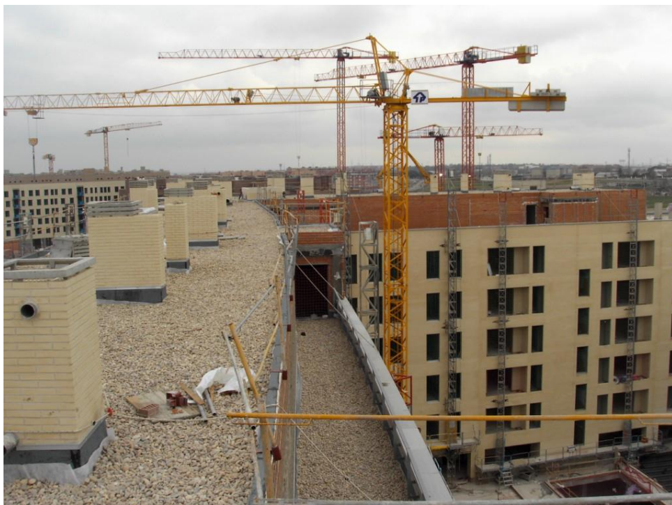
Cubierta portal 8 a2.