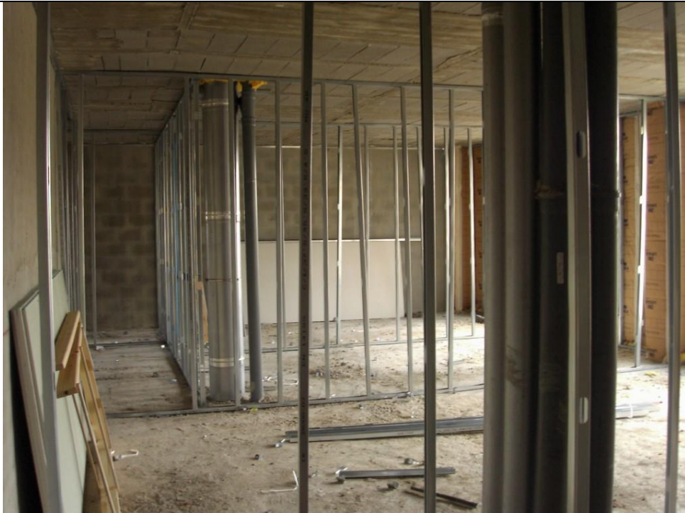
Tabiquería portal 2.