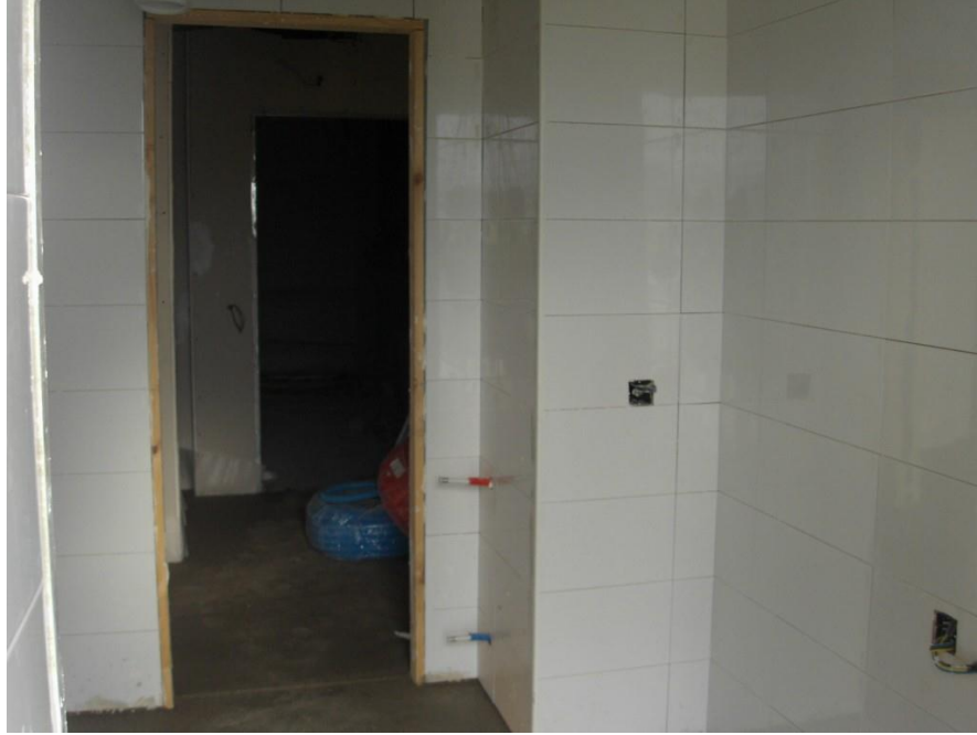
Alicatado de cocina de portal 6