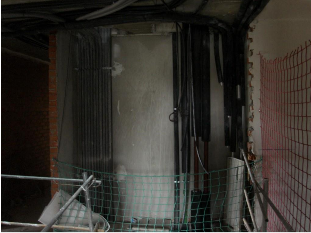
Instalaciones en portal 4