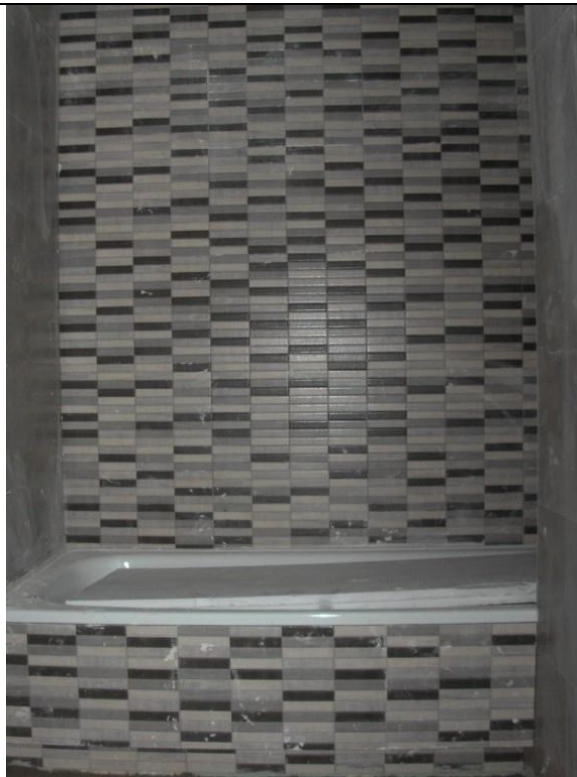
Alicatado de baños.