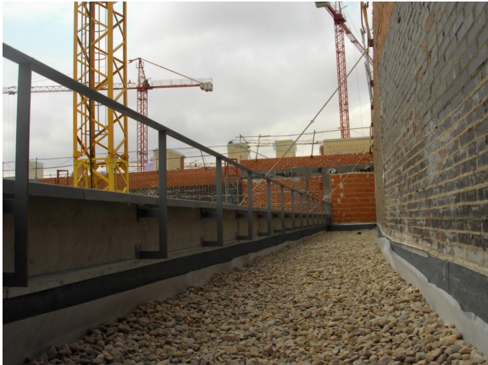
Cubierta Instalación barandillas.