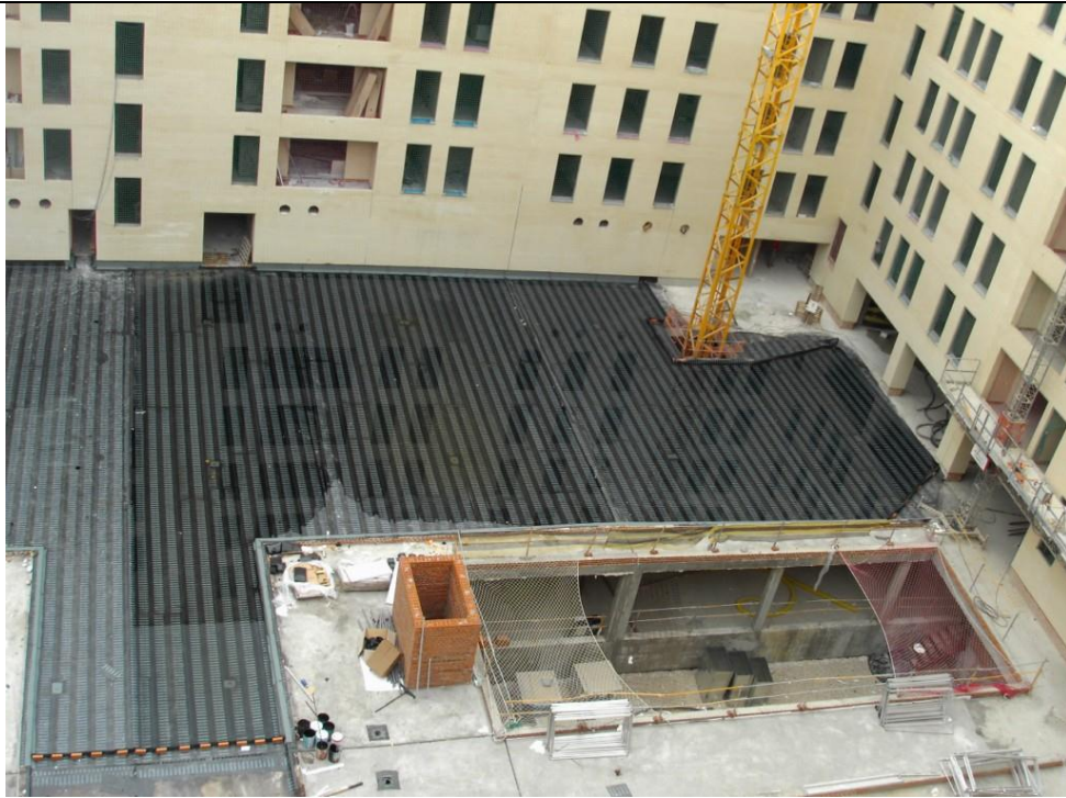
Vista desde cubierta, impermeabilización patio central.