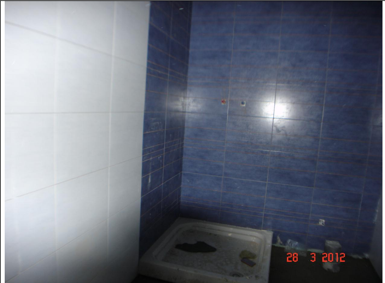
Alicatado baño con plato de ducha