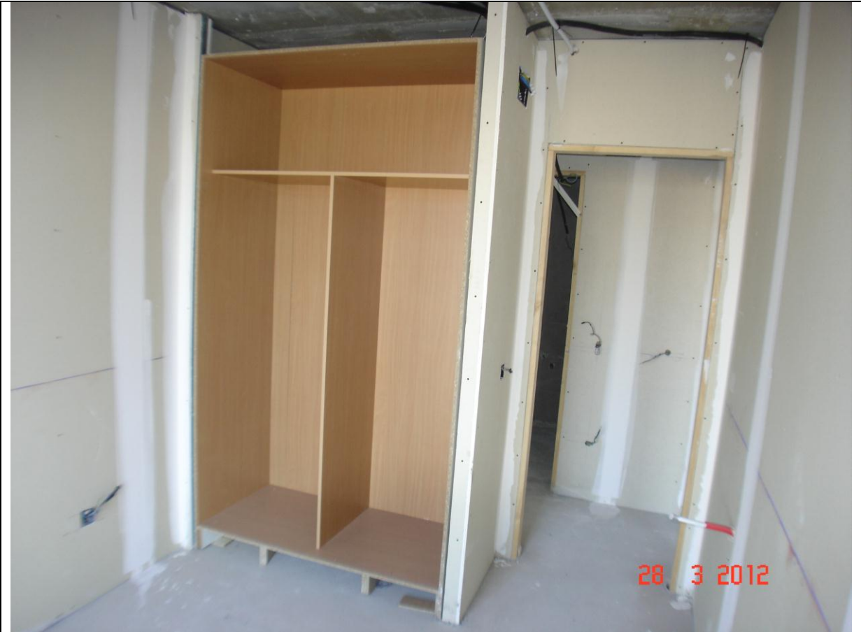
Instalaciones de armarios viviendas del portal 6