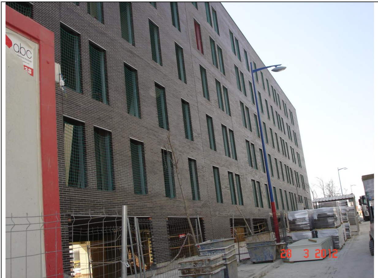
Vista general edificio.