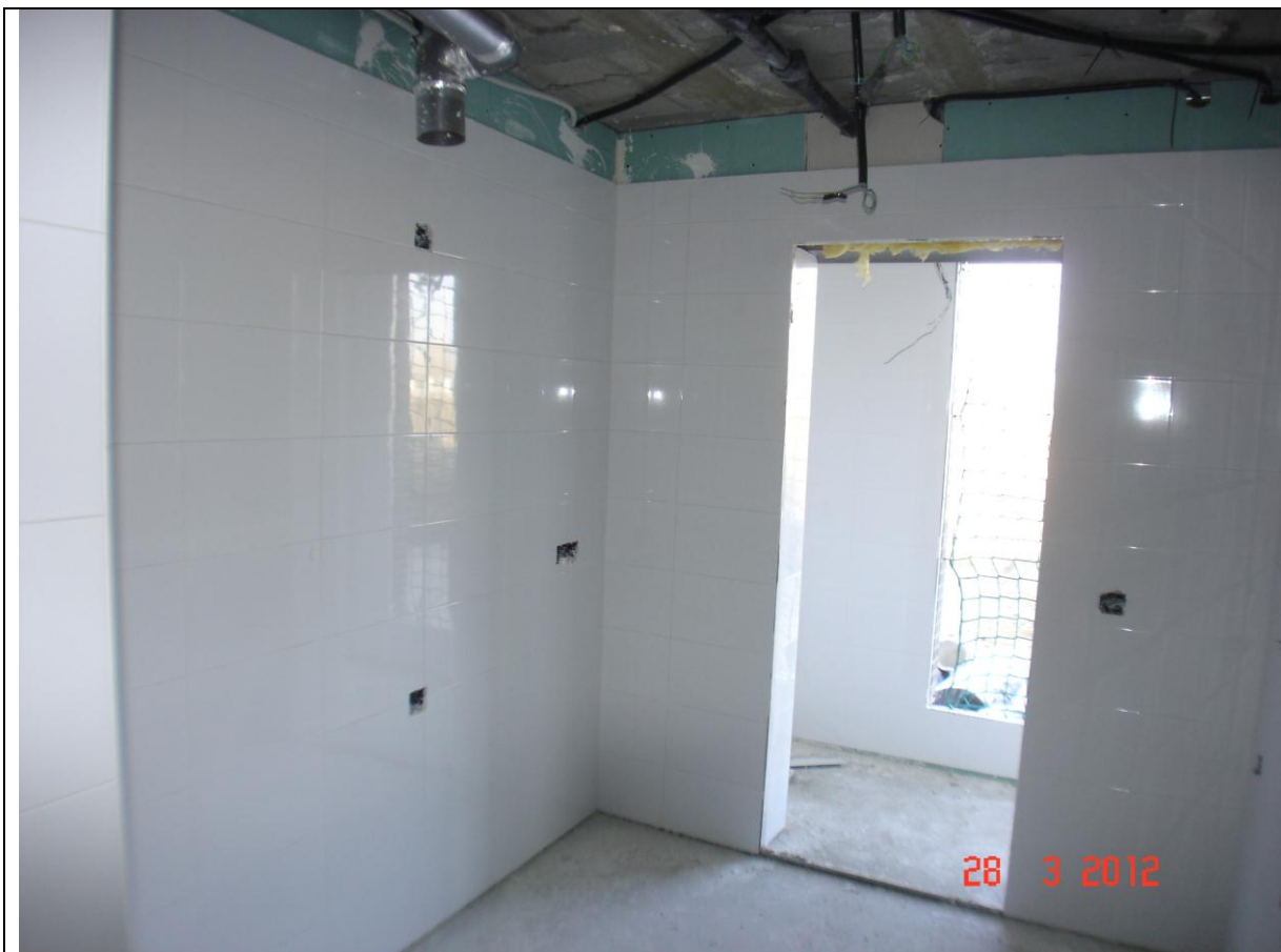
Alicatado de cocina del portal 6