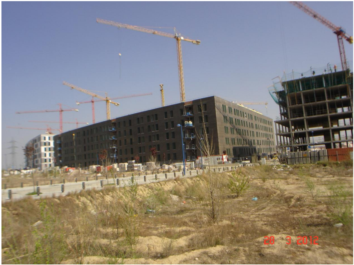
Edificio dentro de su entorno.