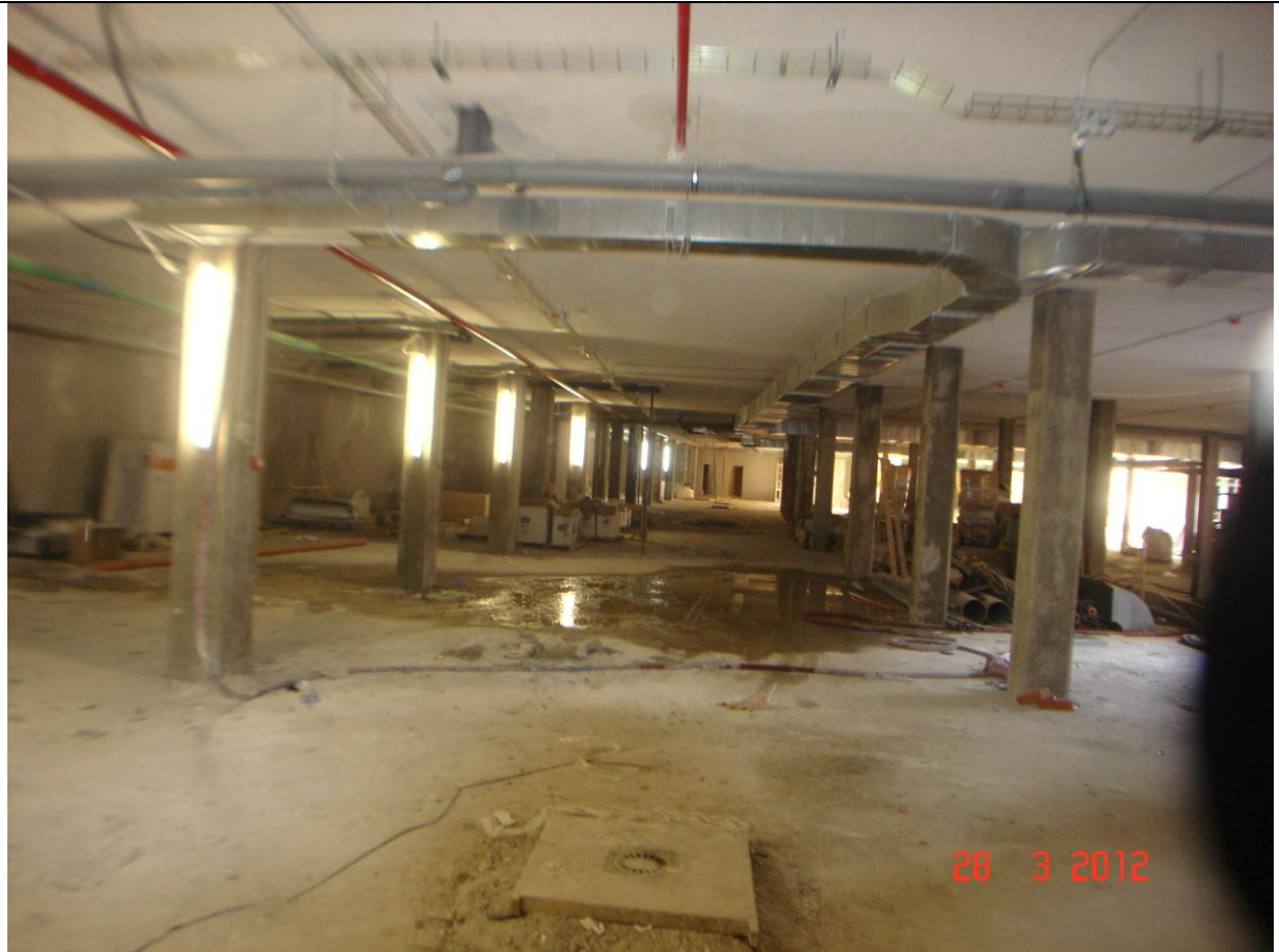
Interior sótano garaje aparcamiento.