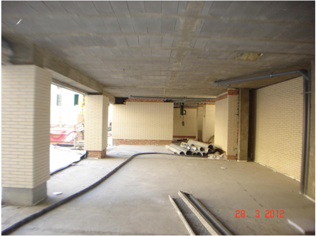
Soportales vista interior.