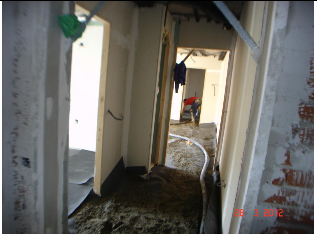
Extendido de soleras en vivienda portal.