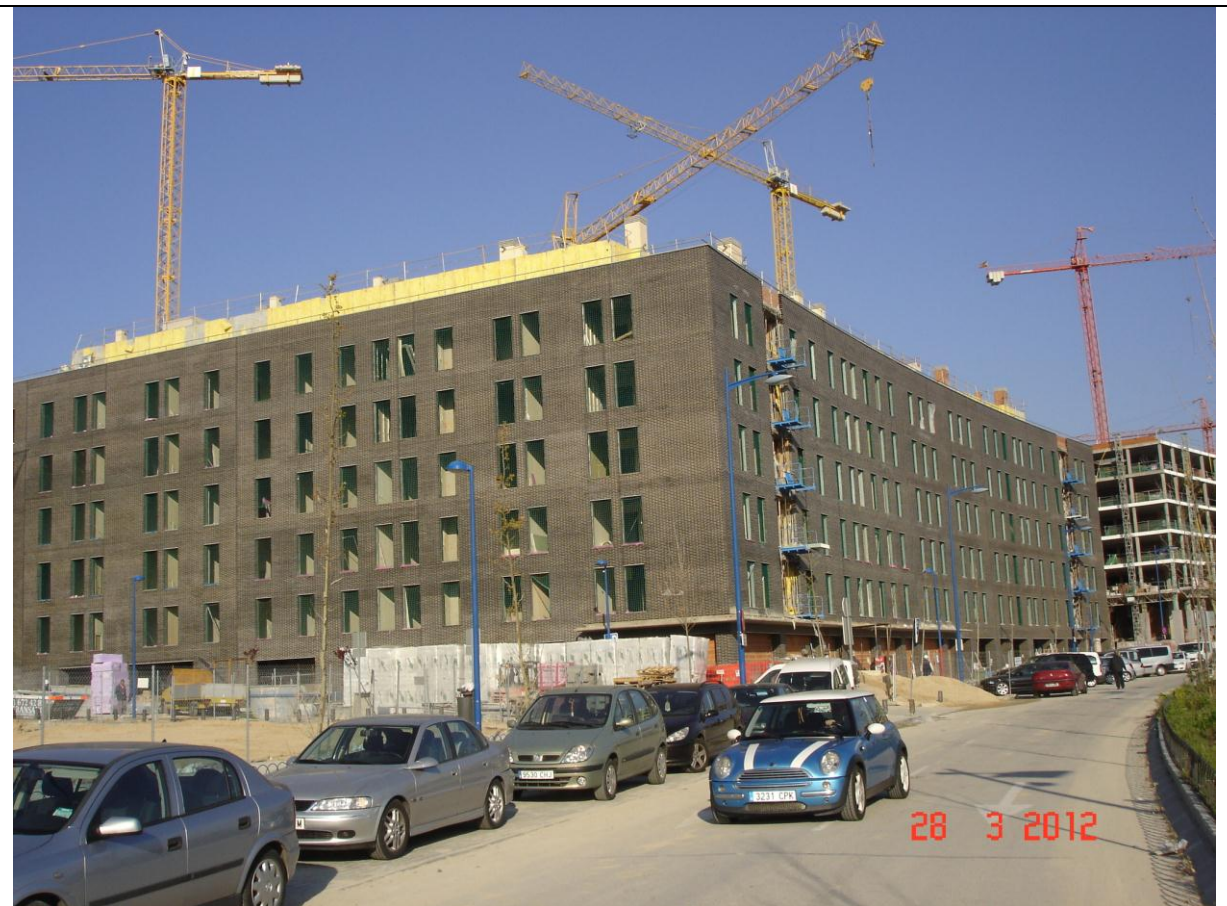
Vista general edificio.