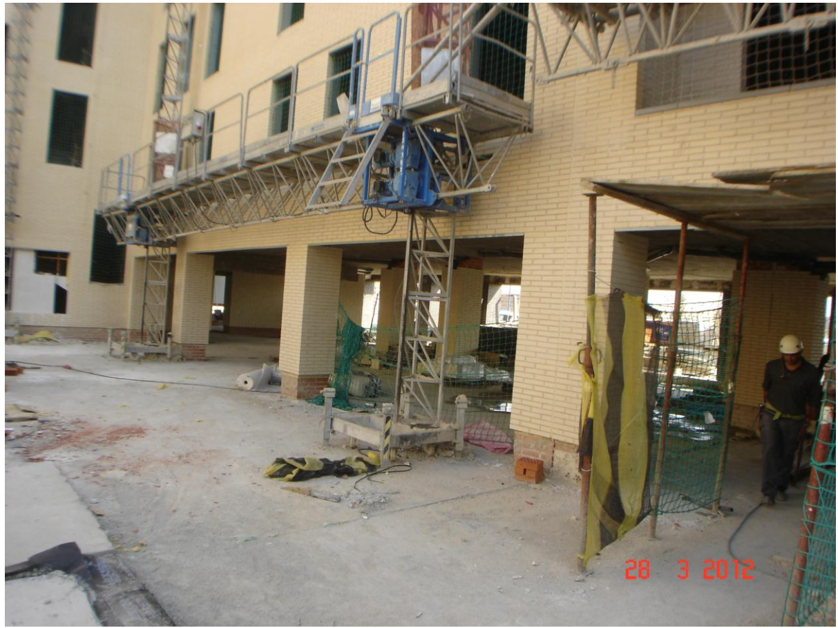
Vista soportales desde patio central.