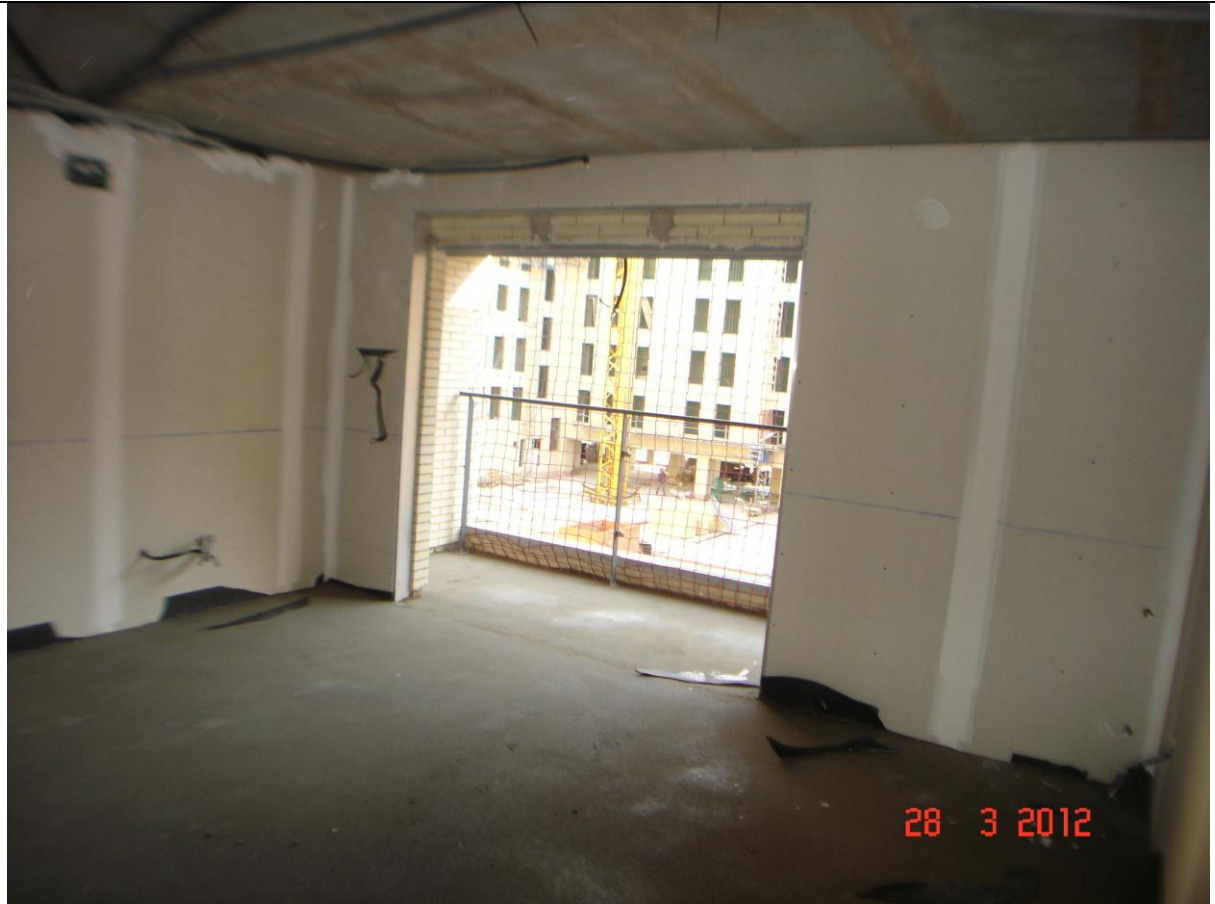
Vista salón y terraza con solera terminada.