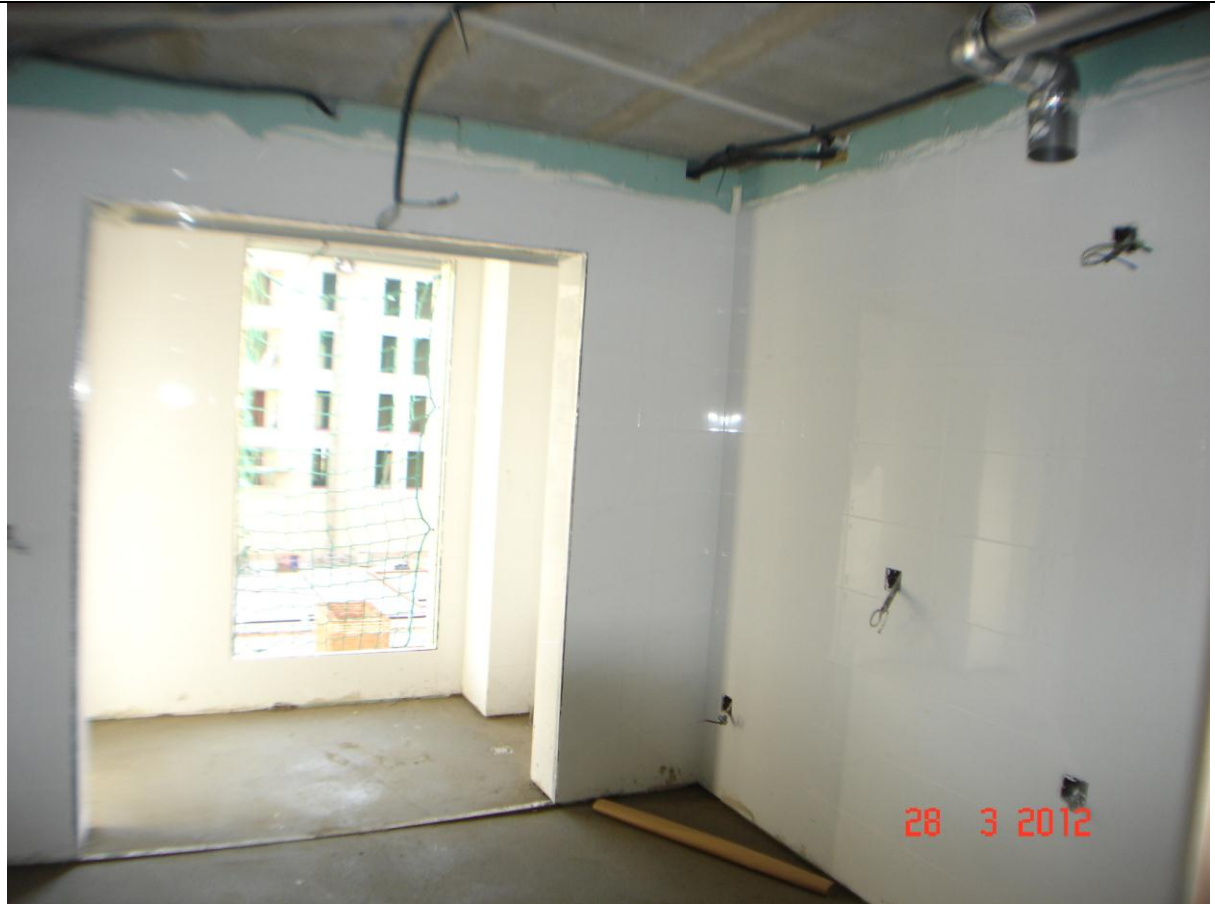
Alicatado cocina y vista tendedero.