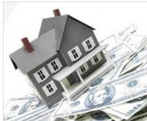
Aprovecho la deducción por vivienda o espero a que siga bajando más

¿A quién le interesa adelantar la compra? Según Olivia Feldman, del portal hipotecario HelpMyCash.com , las rentas más perjudicadas por el final de la desgravación por vivienda son las que van desde los 24.000 euros hasta