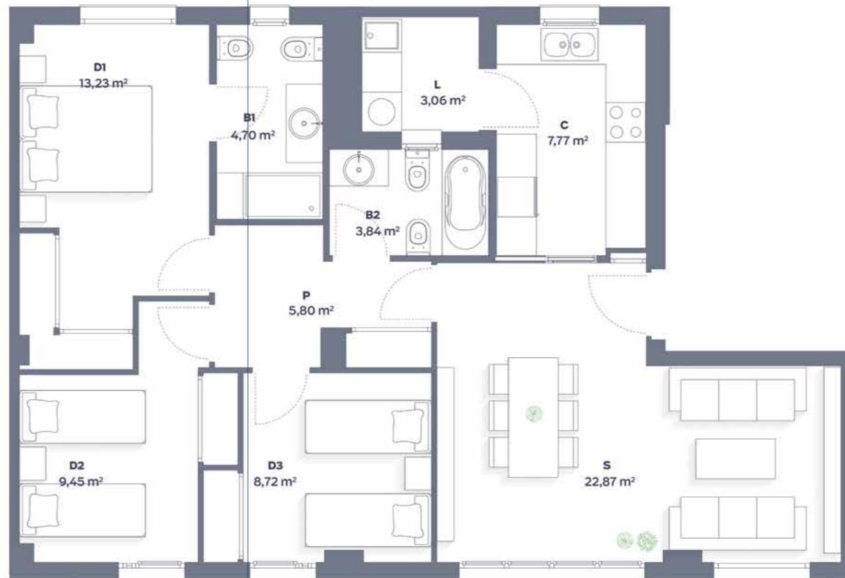
PLANO 1: 3 HABITACIONES 2 BAÑOS

Nuestras viviendas pueden ser de 2, 3 o 4 dormitorios y cuentan con plaza de garaje y trastero. Te ofrecemos diferentes opciones de distribución para que encuentres la que más se adapta a tu estilo de vida y el de los tuyos.