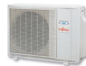
ACY 35-40-50 Ui B