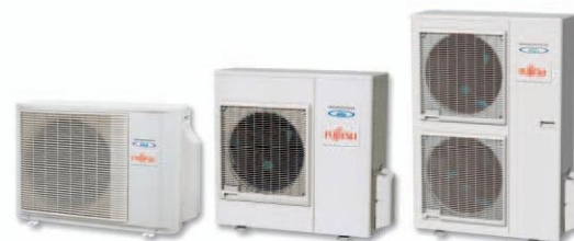
ACY 71 Ui B