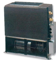
ACY 35-40-50 Ui B (impulsión directa)