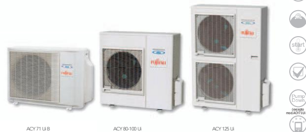
ACY 71 Ui B