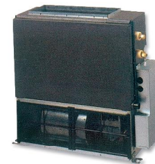
ACY 35-40-50 Ui B (impulsión directa)