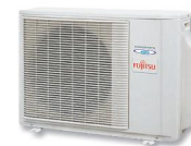
ACY 35-40-50 Ui B