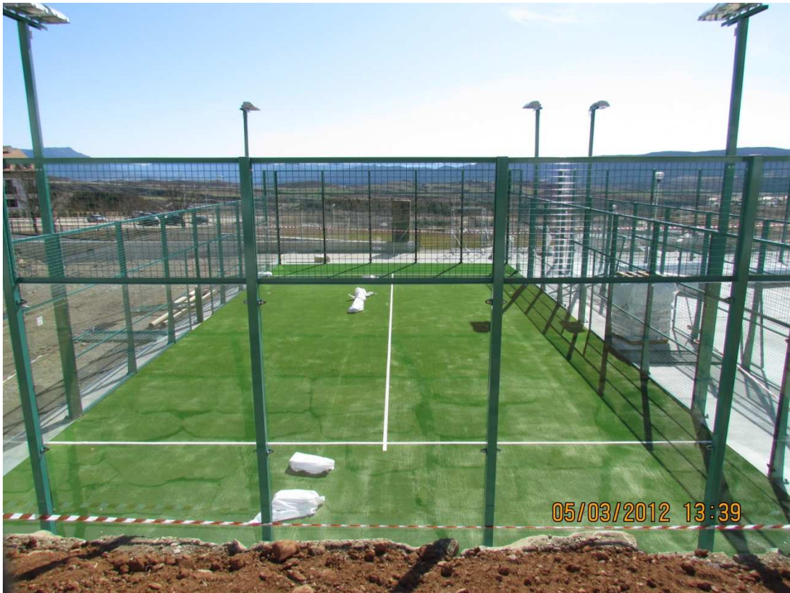
Fotografía 7 estado fase II pistas a 5 de Marzo de 2012