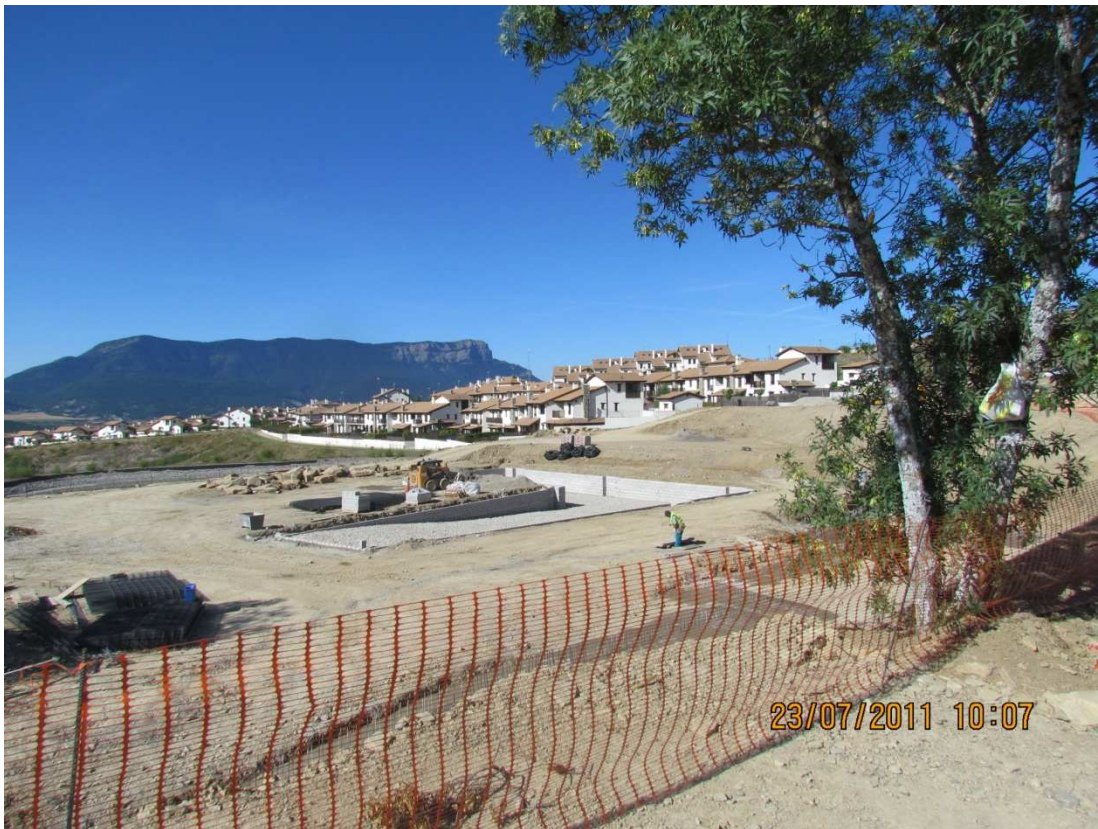
Fotografías 1 y 2 estado obras a 23/07/2011 estructura y piscina realizadas