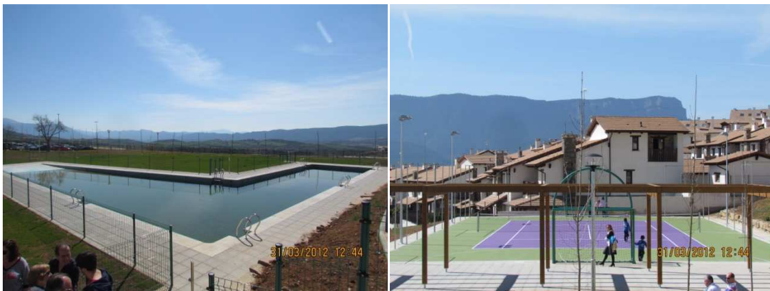
Fotografías 8 y 9 obras terminadas en 31/03/2012 día de la inauguración a la que asiste el concejal de deportes. Fecha licencia definitiva según Proyecto de Ejecución