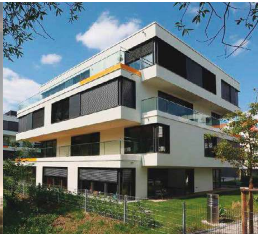
THALKIRCHEN - MUNICH