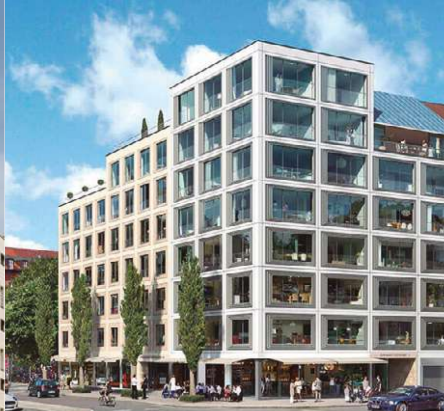
GLOCKENBACH SUITES - MUNICH