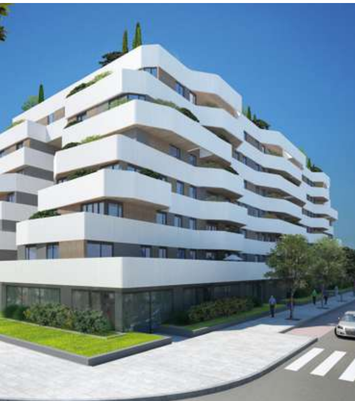
RESIDENCIAL ROTTERDAM - CAÑAVERAL