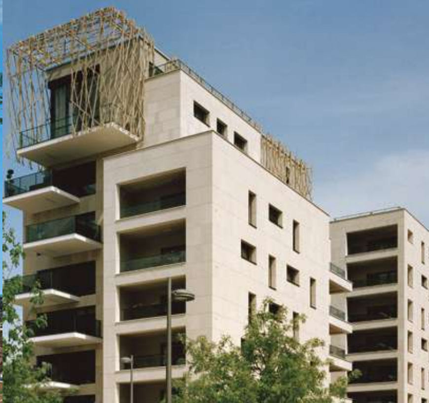
LYON - CONFLUENCE