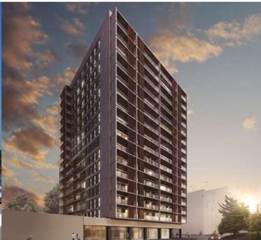
EDIFICI LH CENTER TOWER - BARCELONA