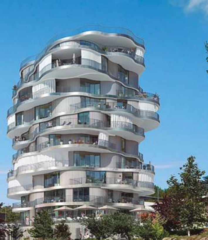
FOLIE DIVINE - MONTPELLIER