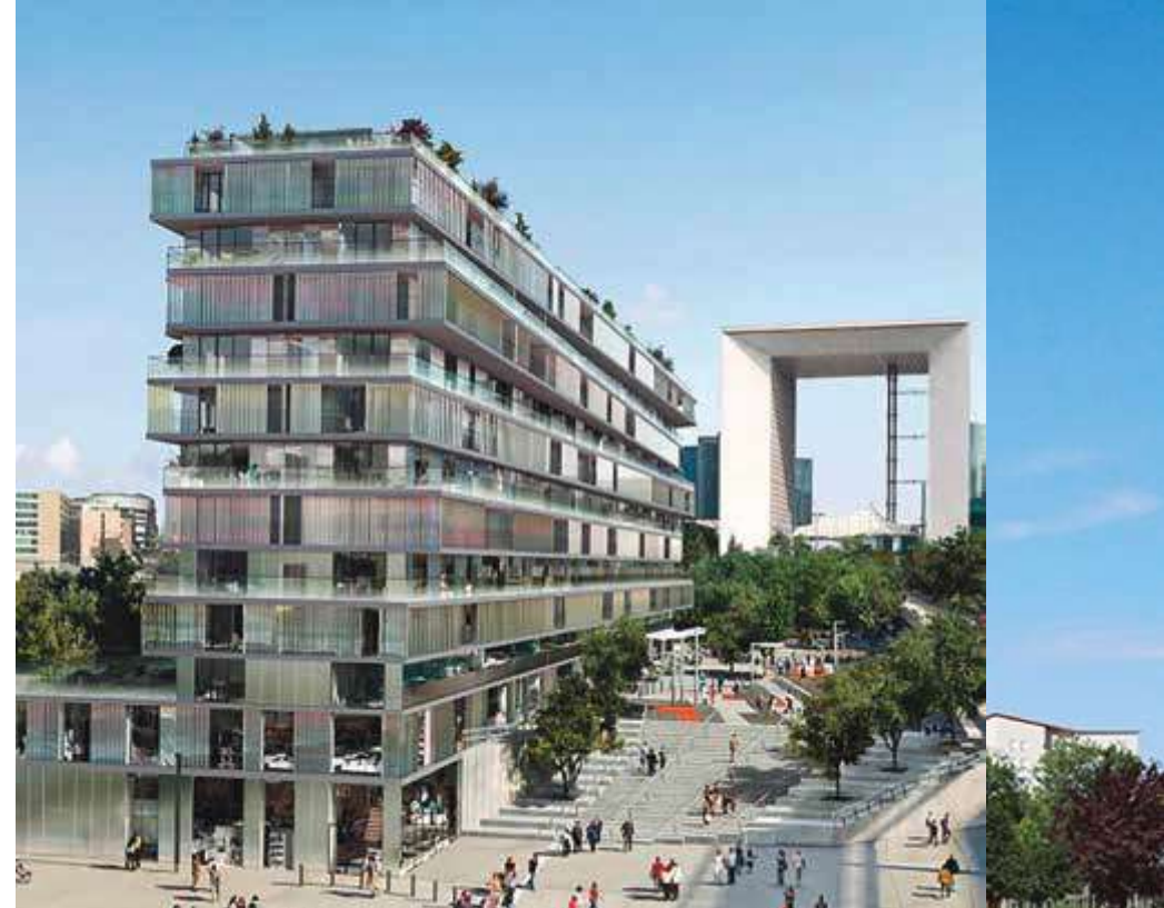
EDIFICIO ONE - PARIS

Nuestra estructura empresarial une la fuerza, el rigor y la solvencia de la dimensión internacional con la agilidad y la eficiencia de una organización descentralizada, disponiendo en España desde el año 1989 de delegaciones territoriales en Madrid y Cataluña.