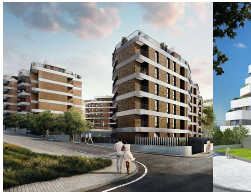
RESIDENCIAL MELBOURNE - RIVAS