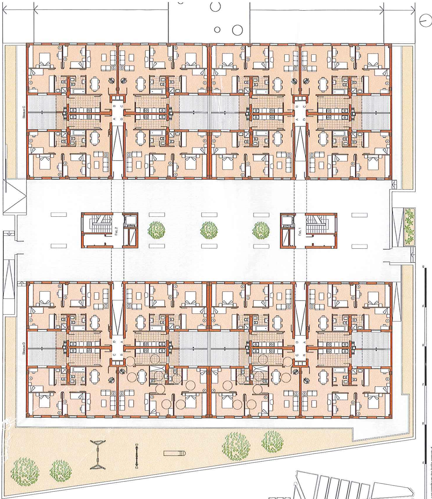
PLANTA BAJA BLOQUES C Y D