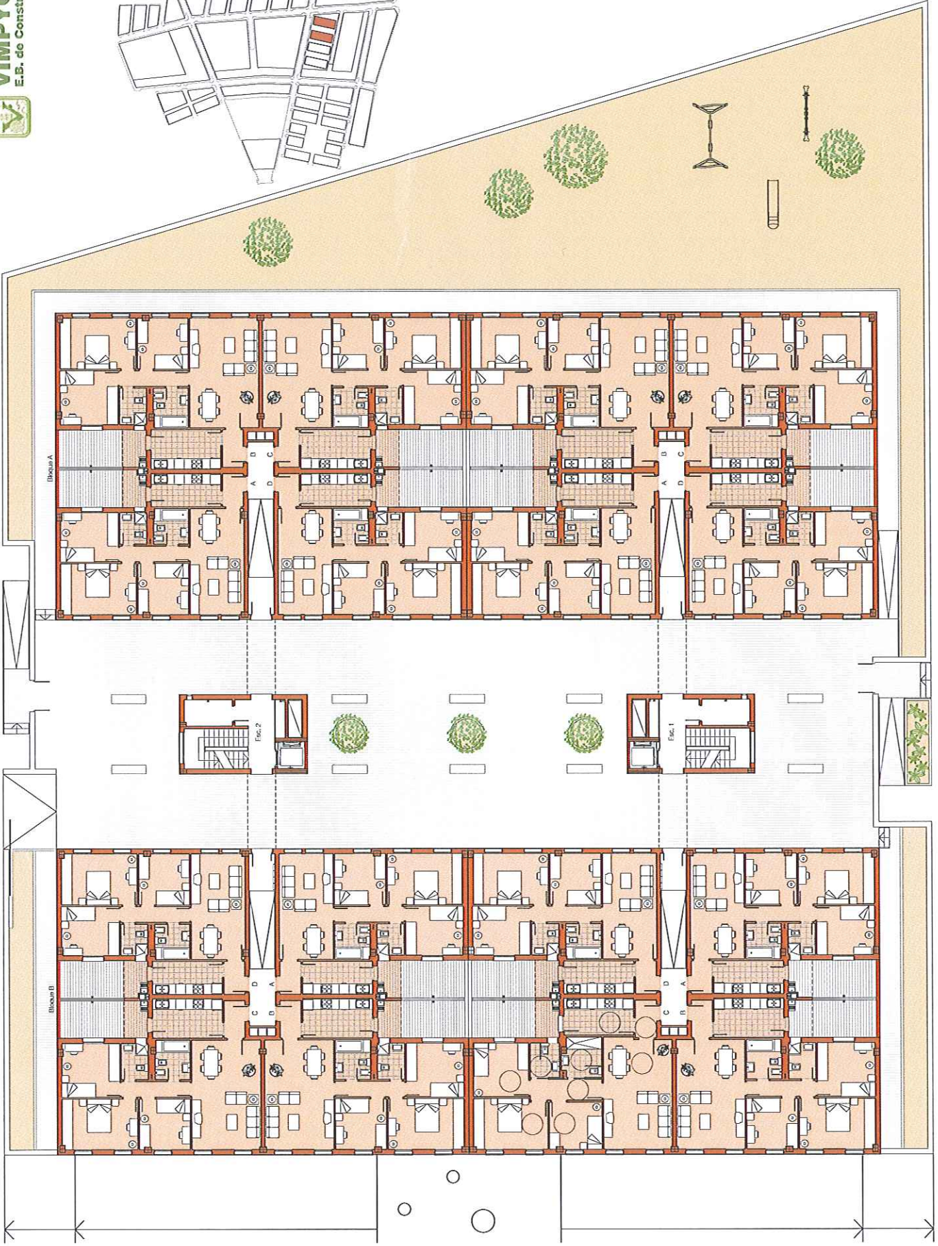
PLANTA BAJA, BLOQUES A Y B

CONJUNTO RESIDENCIAL DE V.P.O. "LOS GIRASOLES" EN MANZANA 4 DEL SUS/SE-1 DE PALMA DEL RÍO, CÓRDOBA, 96 VIVIENDAS DE PROTECCIÓN OFICIAL, GARAJES Y TRASTEROS.