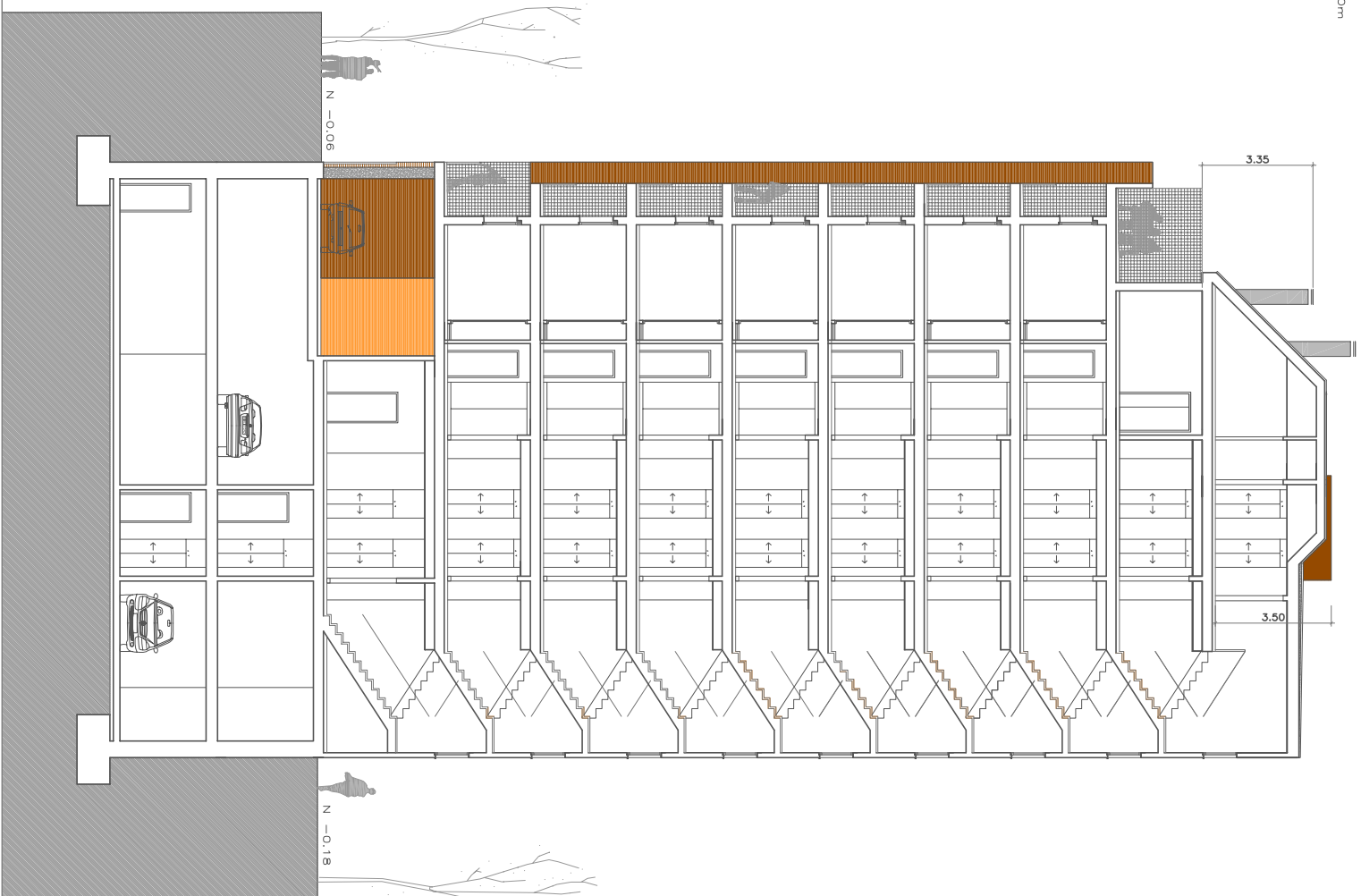
SECCIÓN E 1/100