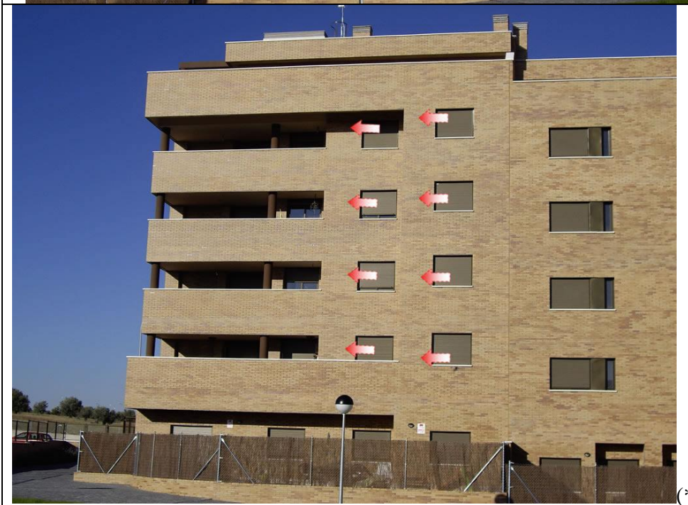
FACHADA OESTE AGUSTINA DE ARAGON 10