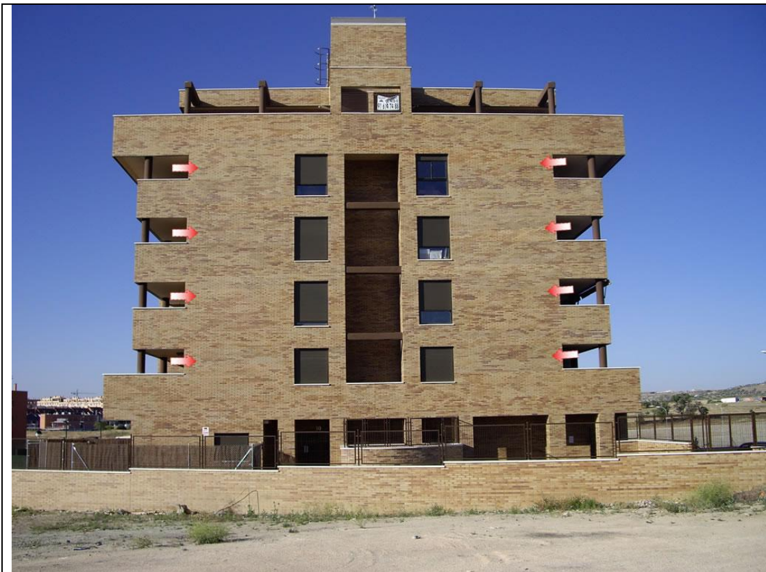
FACHADA NORTE AGUSTINA DE ARAGON 10