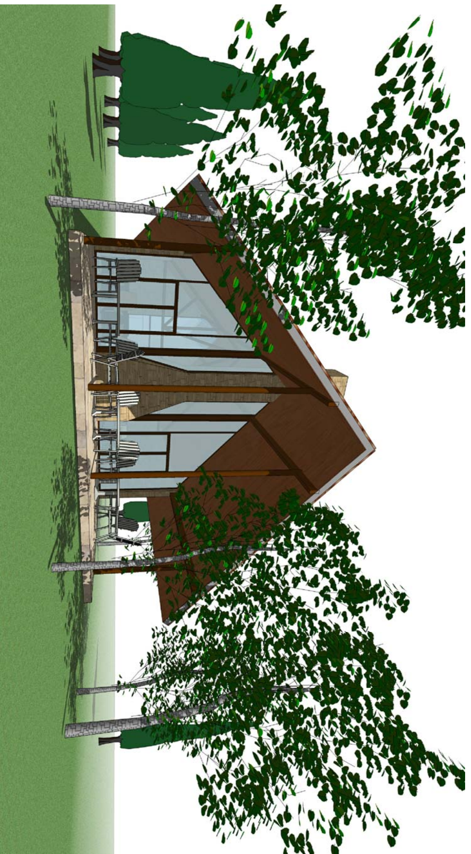
IMÁGENES TERRAZA POSTERIOR