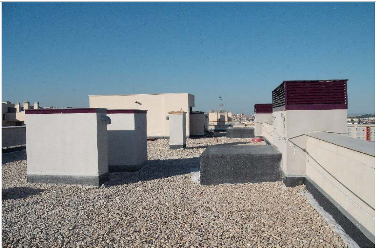
VISTA DE CUBIERTA