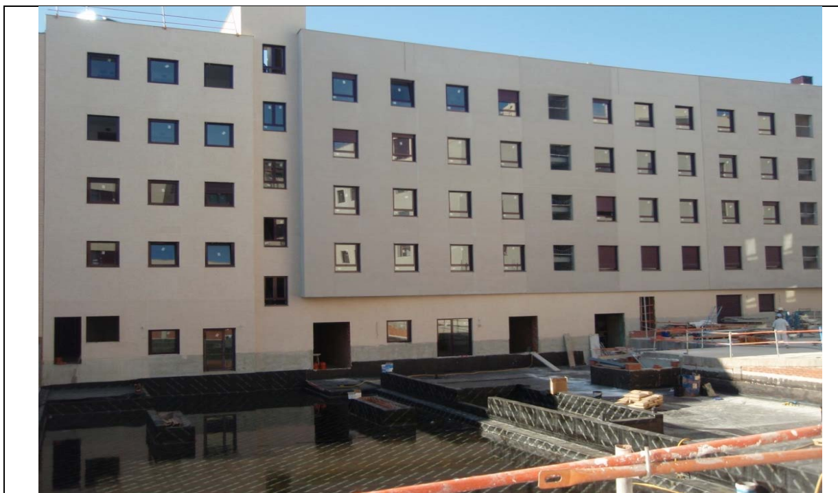
VISTA FACHADA INTERIOR PORTALES 5 AL 7 Y URBANIZACION INTERIOR