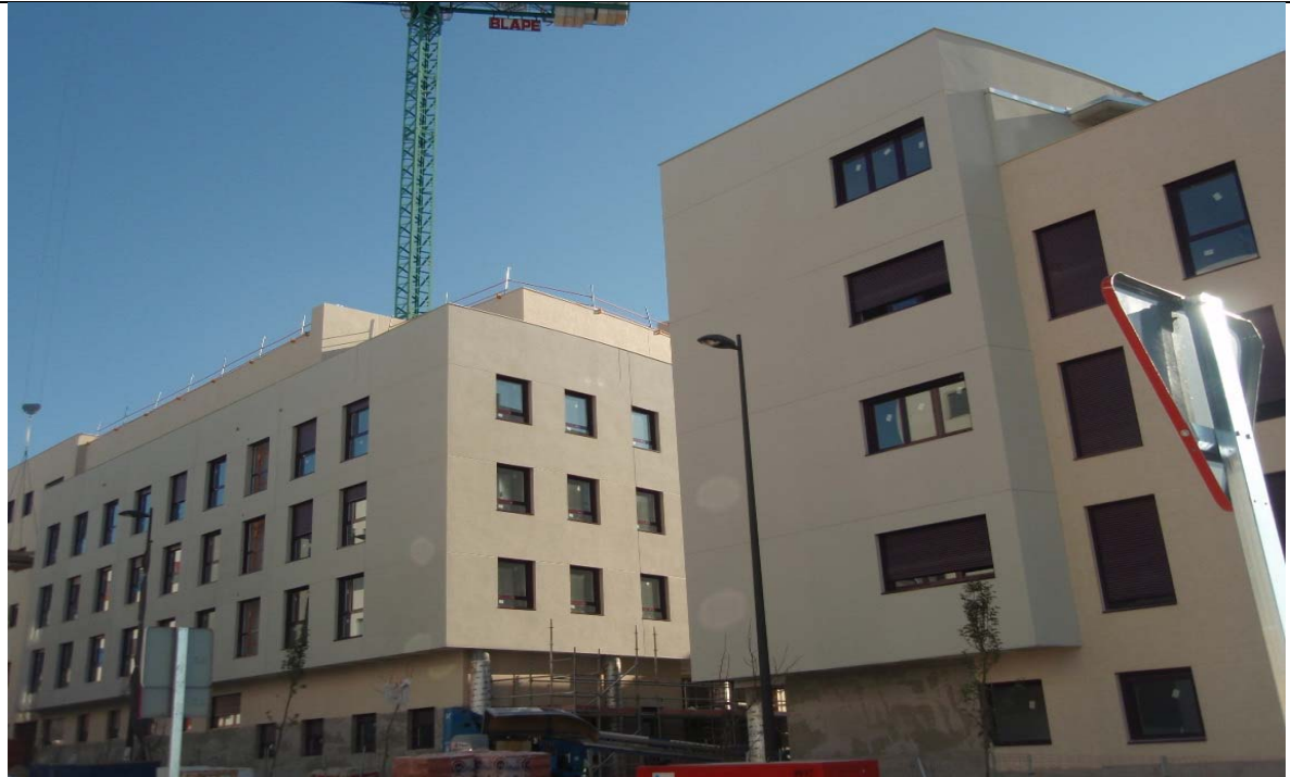
VISTA FACHADA EXTERIOR PORTALES 3, 4 y 5