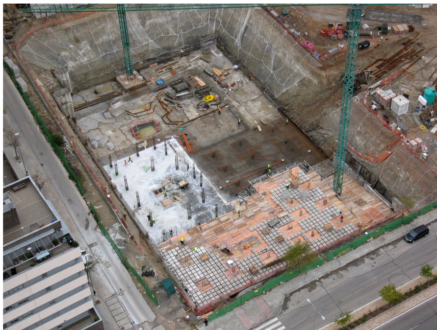
VISTA AEREA DEL ESTADO DE OBRA 2