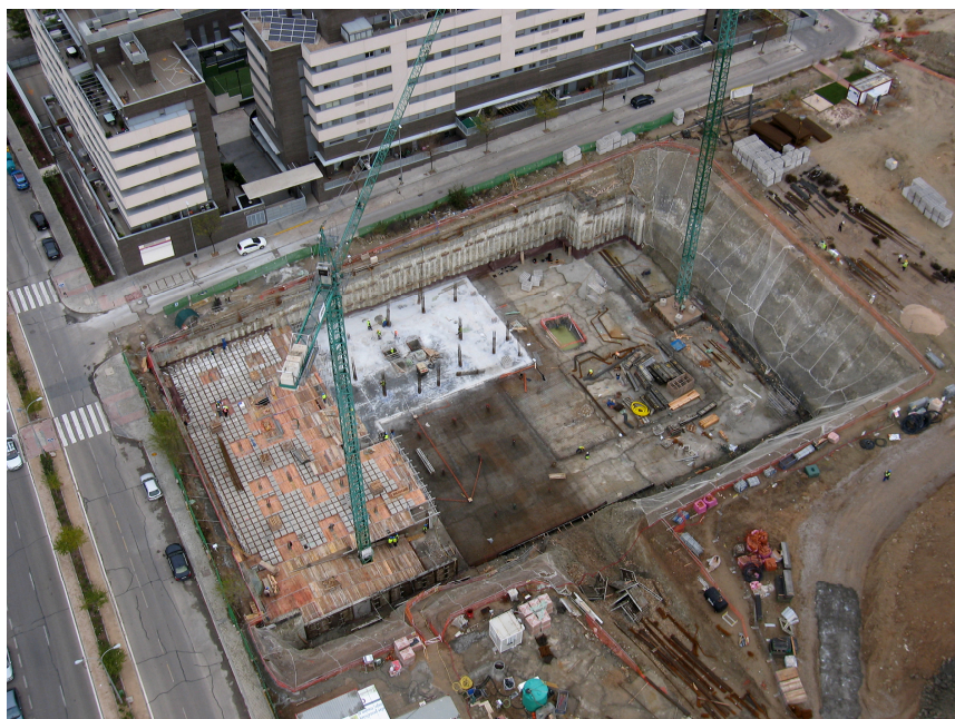
VISTA AEREA DEL ESTADO DE OBRA 1