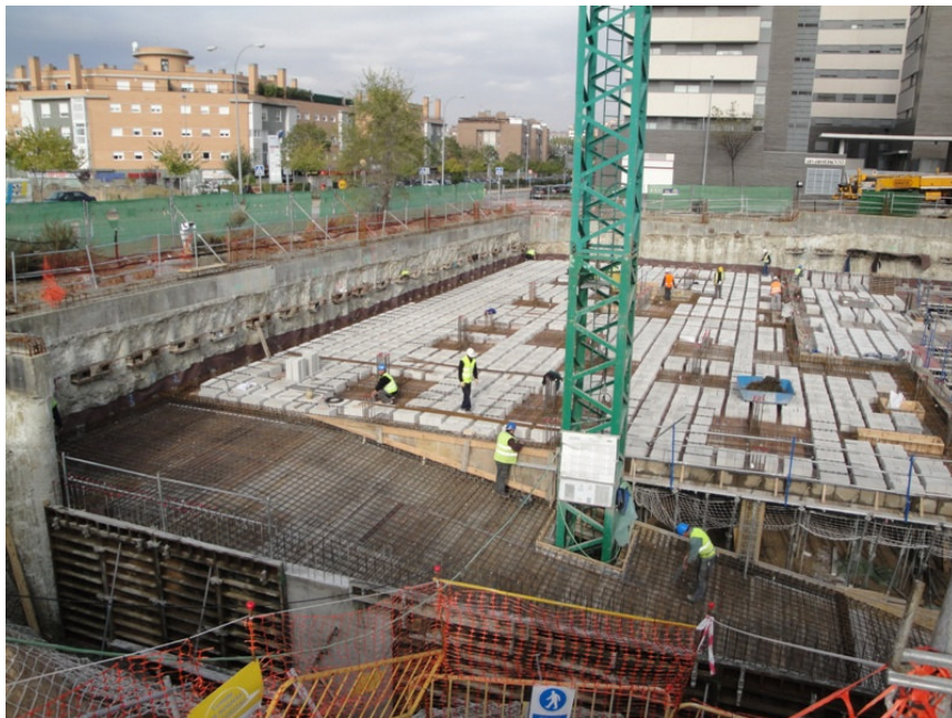
EJECUCION DE FORJADO SOTANO 1